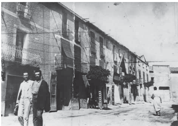
Figura 7: Carrer Sant Roc de Torregrossa. Any 1933.