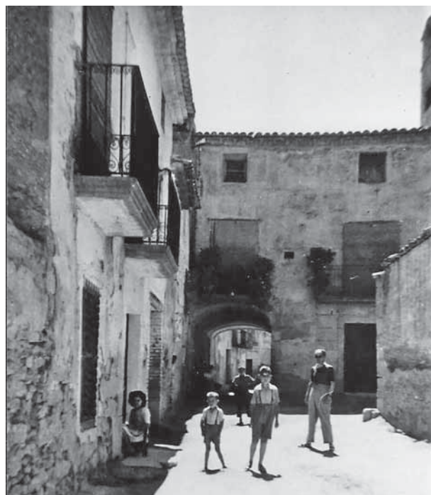
Figura 6: Carrer Arcada de Torregrossa. Any 1930.