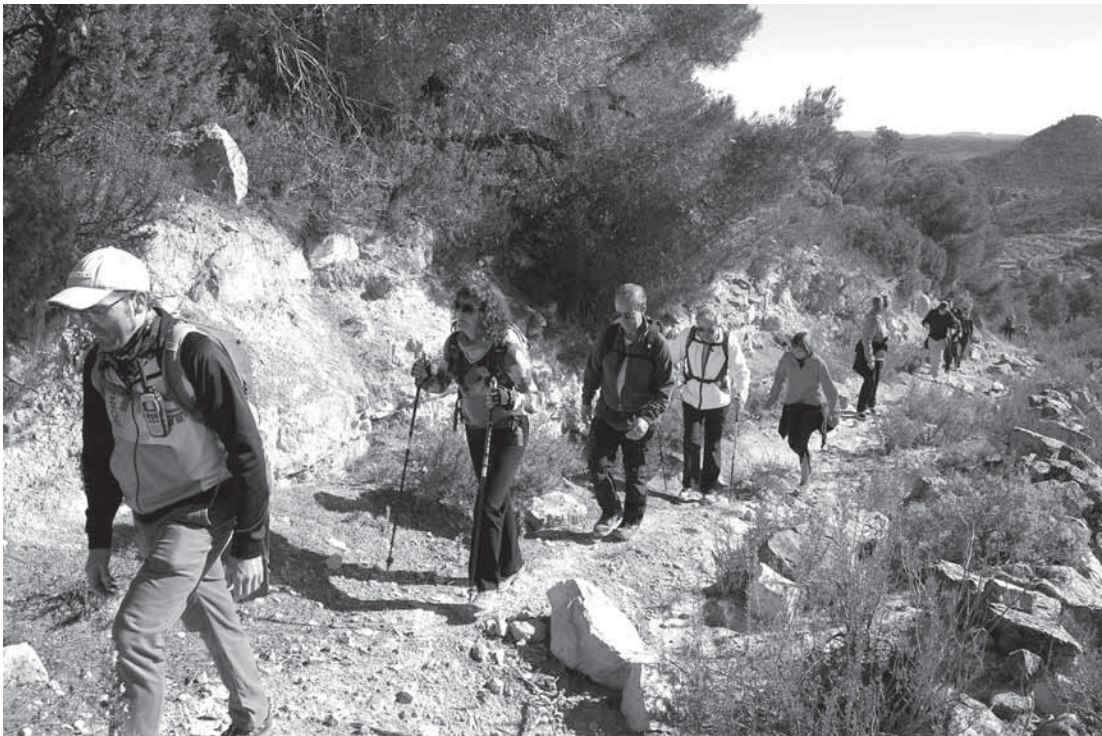
Foto 8. Una de les sortides del Club de la Boira, feta a Vinaixa el 9 d'abril de 2016.