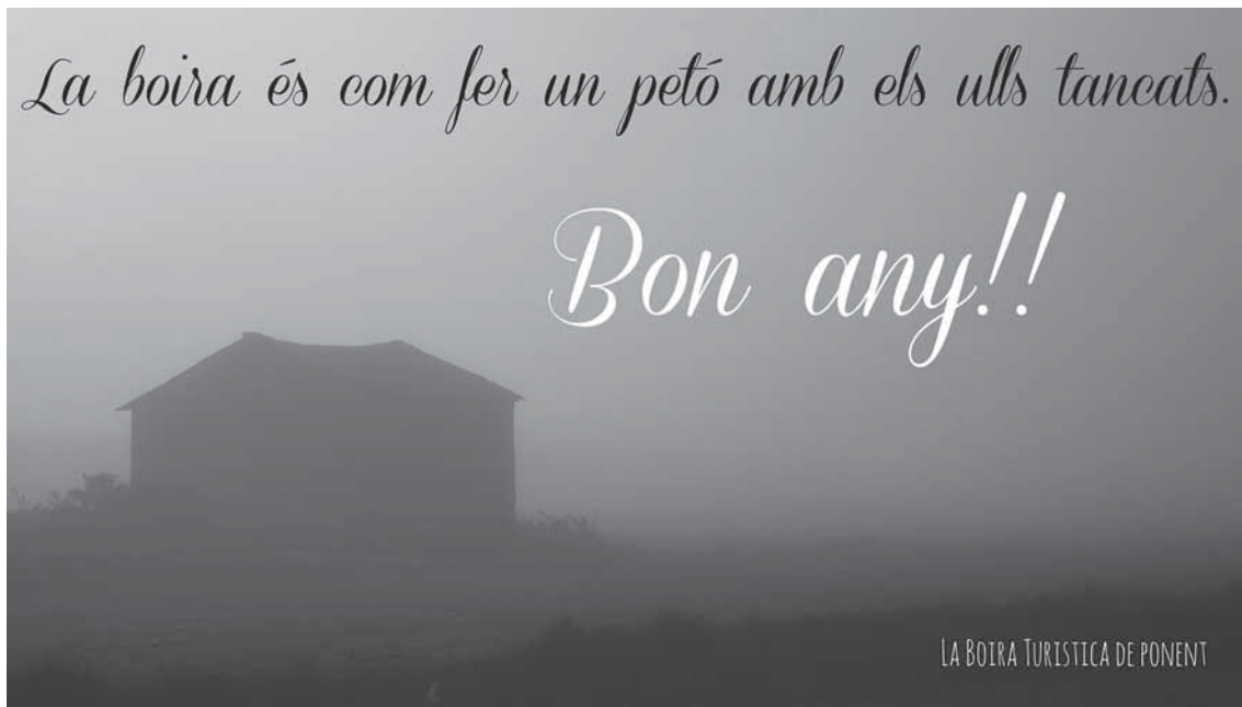
Foto 4. Felicitació de l'any 2016 amb boira, prop del Salt del Duran.