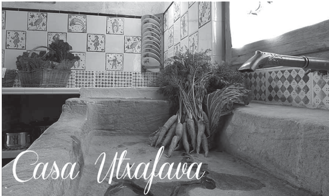
Foto 2. Cuina de Casa Utxafava, a Vila-sana.