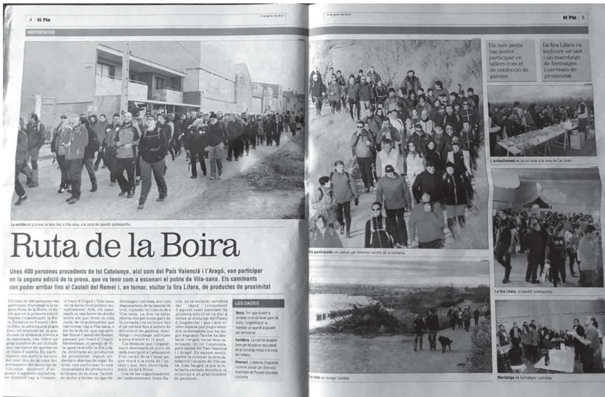
Foto 6. Notícia a la premsa de la segona ruta de la boira.

El primer any hi va haver 200 inscrits. El segon, 450 inscrits. I el tercerensem arribar als 700 inscrits. El segon any, 2016, vam pensar que una part del cost de la inscripció s'havia de destinar a una causa solidària a nivell comarcal. En concret, es va costejar el trasllat d'un cavall de la Camarga per a l'estany d'Ivars i Vila-sana, un animal que pastura al canyissar de depuració (fig. 7). Aquests diners foren entregats al Consorci de l'Estany, i a l'agost de 2016 fou batejat el cavall amb el nom de "Boira-Senill". El 2017 l'ajuda es destinarà a una sortida a la natura adreçada als nens del centre Siloé d'educació especial. Tota una sèrie de reclams que ens han dut molt sovint a ser el cen-