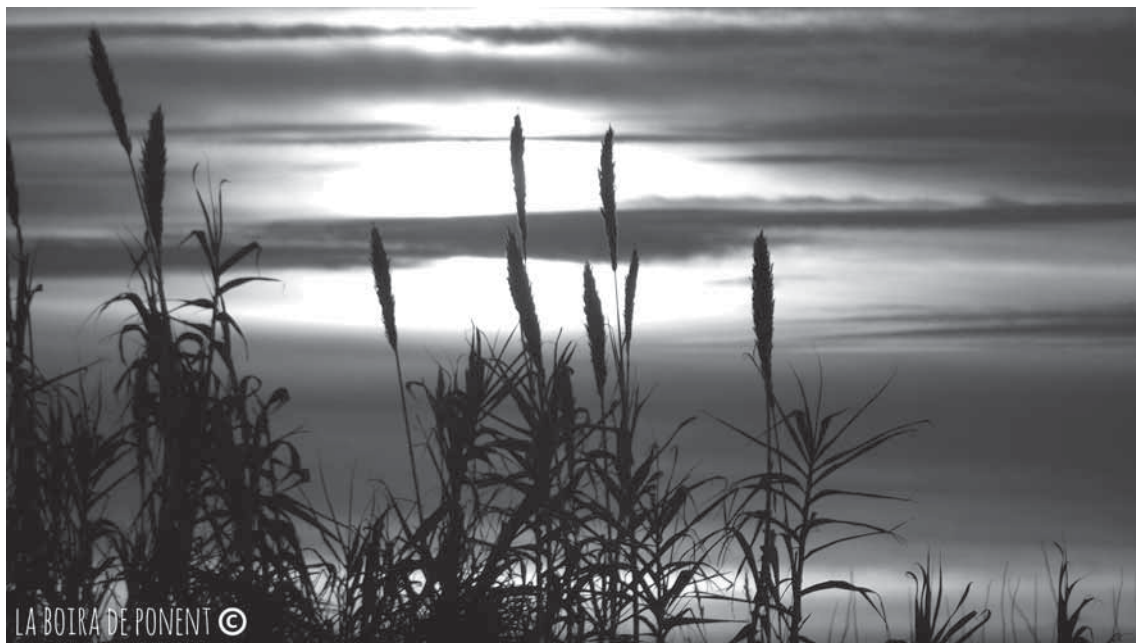
Foto 5. Posta de sol a la partida dels Oberts, terme de Vila-sana, feta el gener de 2014.

tant, cal venir amb sol, però també amb boira (aquesta és la novetat).