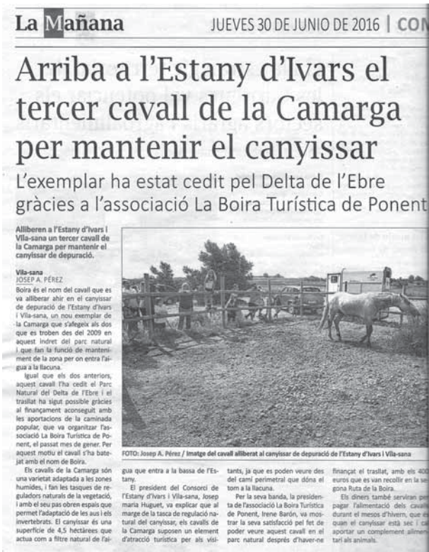
Foto 7. Notícia a la premsa de l'arribada del cavall Boira-Senill.