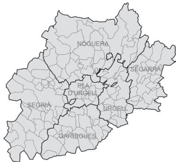
Foto 1. Mapa de les sis comarques de Ponent (edició: Irene Barón).

Concretament, fem referència a sis comarques: el Segrià, la Noguera, les Garrigues, el Pla d'Urgell, l'Urgell i la Segarra (fig. 1). Es tracta de les zones regades