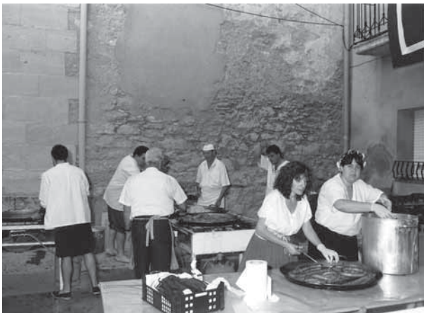
Foto 2. La participació del poble sempre ha estat important. A la fotografia, habitants fent el tradicional sopar.

Deixant de banda l'argument de la història, els Firals són una barreja de teatre, fet per actors locals, una fira d'artesanía on es concentren firaires d'arreu del país, i espectacles que complementen l'obra, com els malabars, la gimnàstica, les danses o els malabars de foc. Uneixen la gent de Bellvís en un conjunt d'actes populars que omplen el cap de setmana d'activitats molt diverses. El públic pot comprar articles artesanals, gaudir del teatre, però també pot sopar un plat típic