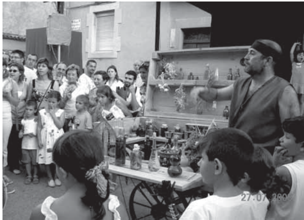
Foto 4. L'embaucador amb gent aplegada al voltant.

apareix un rodamón, popularment anomenat l'embaucador, que porta potatges miraculosos de les Índies per curar els mals i dolències dels veïns de Bellvís; això reflecteix la tradició dels remeis naturals fets amb plantes de la zona (camamilla, timó, romaní, ruella, card, etc.) que es transmetien de generació en generació a través de les dones de la família.