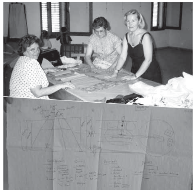
Foto 3. A dalt, modistes confeccionant els primers vestits. Autor: Francesc Fabregat. A baix, part d'estovalles on es va escriure el primer esbós de la festa. Autor: Maria Solé.

A partir d'aquí i gràcies a una gran recerca es va començar a plantejar el guió de l'obra. L'inici dels firals comptà amb la col·laboració de diverses persones i entitats locals i d'arreu de Catalunya. Podem trobar l'Esbart Dansaire de Sant Cugat, que va proporcionar