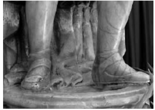
Fig. 16.- Sabates del sant Isidori de Mollerussa.

La datació també funciona a nivell estilístic, ja que, fins ben entrat el segle XVI, a Catalunya es realitza una escultura lligada a la tradició gòtica, sota uns paràmetres etiquetats amb el nom de realisme flamenc. 23 L'obra de Mollerussa mostra les característiques que empen els escultors d'aquest període (1485-1530): la imatge és concebuda amb gran verisme, amb un cos fet des del rigor anatòmic, i, sobretot amb la utilització del drapejat de la roba des d'un caire geomètric i angulós (fixeu-vos en els plecs de la màniga o en la caiguda de la capa de sant Isidori, fig. 12 i 16). També cal tenir en compte la manera singular a l'hora de fer els rínxols cargolats de la cabellera. Tot i que les obres escultòriques conservades d'aquesta època són relativament poques, en comparació amb la llarga nòmina d'artífexs documentats, la tipologia