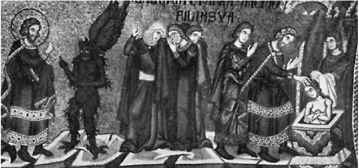
Fig. 4.- Paolo Veneziano i fills, sant Isidor bateja tres dones a Quios, detall de la capella de Sant Isidor, basílica de Sant Marc, Venècia.