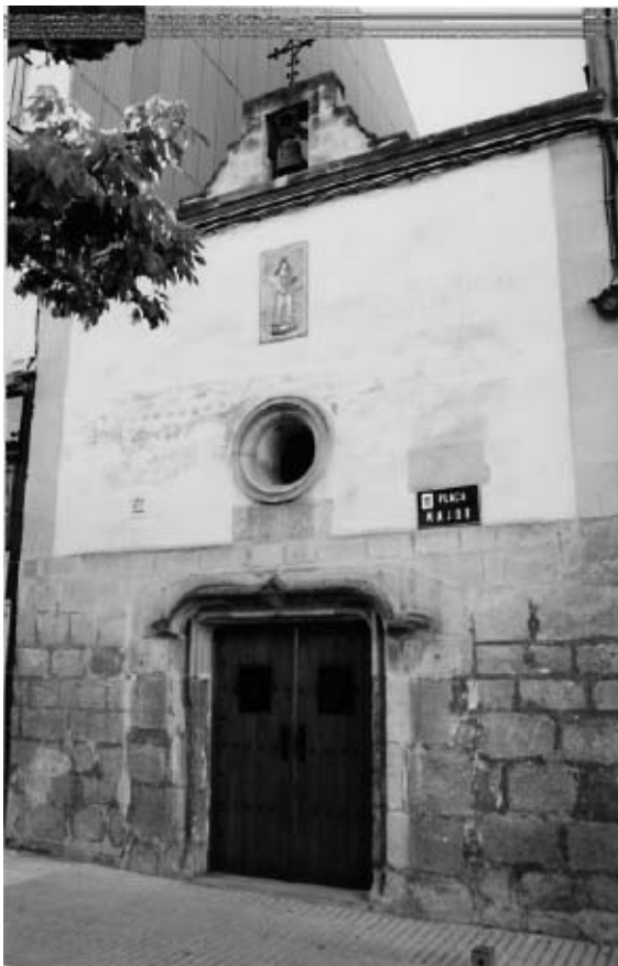
Fig. 7.- Façana, 1575-1640, capella de Sant Isidori, Mollerussa.