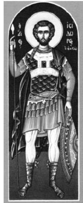
Fig. 1A.- Icona grega de sant Isidor de Quios.

Hi ha molt poques notícies sobre l'hagiografia de sant Isidor de Quios, i les que hi ha són de caire llegendari i contradictòries. Les informacions es troben en la seva Passio , o procés del martiri, escrit a Quios a la primera meitat del segle V; també en la vida de sant Marcià, escrita a la segona meitat del segle V; i en una altra Passio , escrita a Constantinoble (actual Istanbul), en un període posterior. Sembla que hauria nascut a Alexandria (actual Egipte) i que