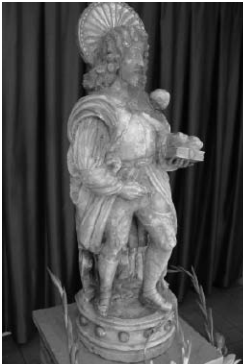
Fig. 12.- Anònim, Sant Isidor de Quios, 1500-1525, capella de Sant Isidori, Mollerussa.