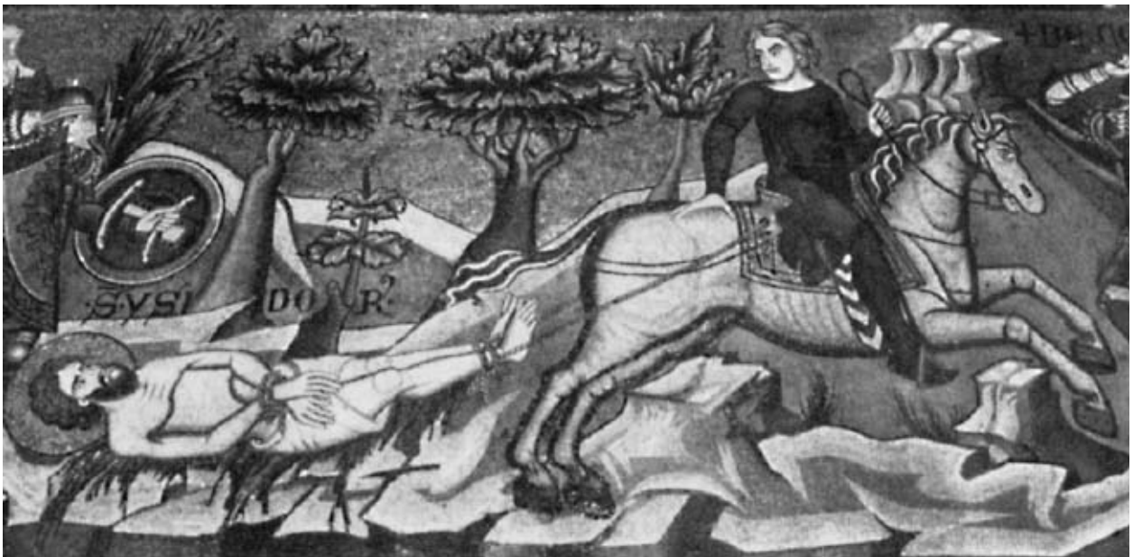
Fig. 5.- Paolo Veneziano i fills, sant Isidor és arrossegat per un cavall, detall de la capella de Sant Isidor, basílica de Sant Marc, Venècia.

l'Esquilí, prop de l'actual església de Santa Bibiana (a tocar del que avui és la Stazione Termini); un temple romà que també va gaudir de monestir, i que està documentat fins al segle xv. 5 Al segle ix el culte entra a França, a través dels bisbes d'Aquitània (com l'historiador sant Gregori de Tours) es va difondre a ciutats com Arlès, Clarmont, Trèveris, i allí cap ciutats de l'imperi a l'imperi germànic, com Colònia. A inicis del segle x el culte comença a difondre's per la península Ibèrica, tal com demostra el privilegi reial de l'any 924 per als monjos de Dueñas (Palència); ja al segle xi a l'actual província de Burgos, entre els rius Arlanzón i Duero: San Isidoro de Muñó (documentat el 1013, avui és un despoblat dins el municipi de Palazuelos de Muñó), el monestir de San Isidoro de Clunia (documentat entre 1030-1035 a l'antiga vila romana de Clunia, avui entre els municipis