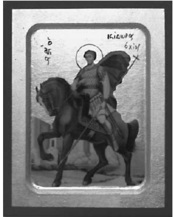
Fig. 1B.- Icona grega de sant Isidor de Quios.

Amb el pas dels anys, la tomba d'Isidor va esdevenir un lloc de guariments miraculosos. En aquest indret, Letsaina o Letsena (al nord de la ciutat de Quios, capital de l'illa del mateix nom), es va erigir una església al segle v, promoguda per sant Marcià. Actualment, hi trobem un temple ortodox, amb les restes d'una basílica paleocristiana construïda al segle vii, a l'època de l'emperador bizantí Constantí IV Pogonatos (668-685) dins de la qual hi ha una cripta subterrània, on hi havia les