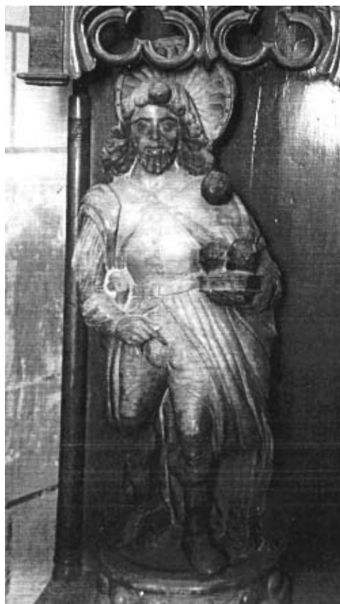
Fig. 10.- El sant Isidori de Mollerussa l'any 1922.