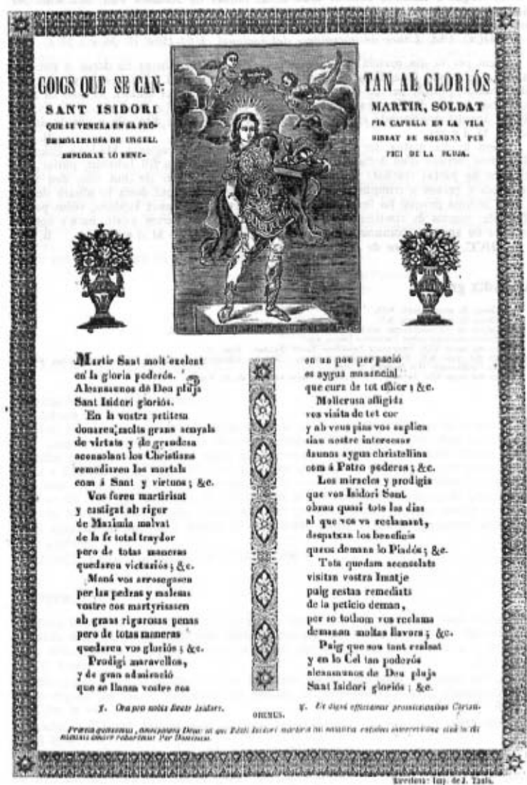
Fig. 6.- Goigs dedicats a sant Isidor de Quios, segle XIX, Mollerussa.