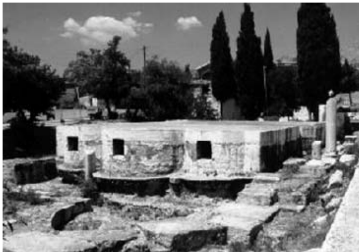
Fig. 3A-3B.- Restes arqueològiques de la basílica dedicada a sant Isidor a Letsaina, a la ciutat de Quios.

L'hagiografia de sant Isidor de Quios no apareix a la Llegenda àuria (escrita al voltant de l'any 1260), de Jacopo da Varazze (o Jaume de la Voràgine), i tampoc al Flos sanctorum (1599-1601), de Pedro de Ribadeneira. Tot i això, el culte vers al sant es va estendre amb anterioritat, ja que fou un sant molt popular a l'època antiga i altmedieval. En els segles immediats al seu martiri, el culte es va propagar per indrets propers al mar Egeu (l'illa de Tinos i l'illa de Creta), i després cap als llocs que hi tenien contacte: Venècia i les seves colònies de la costa dàlmata (la ciutat de Zadar, i s'introduiria cap a l'interior, com a Karan –Sèrbia– o a De Čani –Kosovo–) i l'illa de Xipre (i des d'aquí cap al nord d'Àfrica: l'Egipte copte, prop de Mateur, a Tunísia, o Guelma, a Algèria). La primera església dedicada a Roma apareix esmentada al Liber Pontificalis de la vida del papa Lleó X (795-816), i estava ubicada entre la Porta Tiburtina i el temple de Sant Eusebio, al turó de