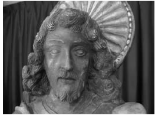
Fig. 22.- Anònim, cap de sant Isidor de Quios, 1500-1525, capella de sant Isidori, Mollerussa.