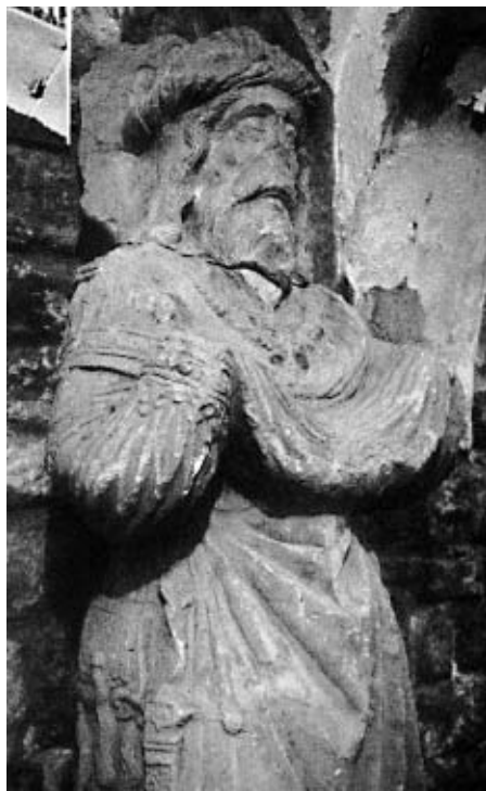
Fig. 15.- Anònim, Nicodem, 1500-1525, Museu Municipal, Agramunt.