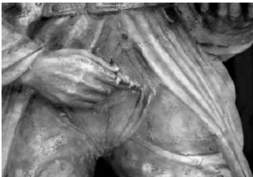
Fig. 11.- Calces de sant Isidori, subjectades amb "agulletes".