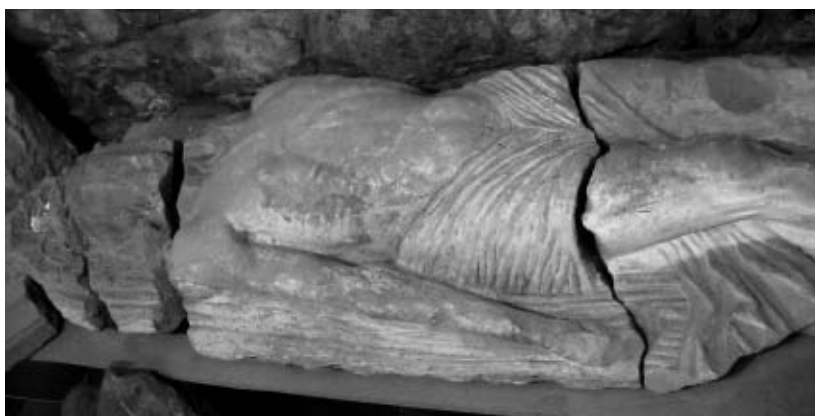
Fig. 27.- Anònim, Crist jacent, 1500-1525, Museu Municipal, Agramunt.