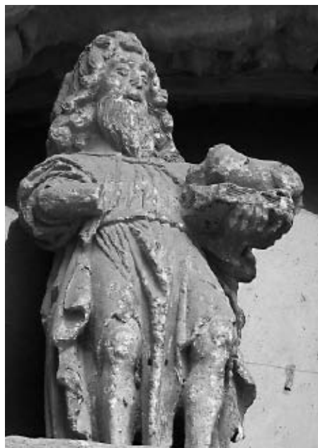
Fig. 14.- Anònim, sant Joan Baptista, 1500-1525, església parroquial, Agramunt.