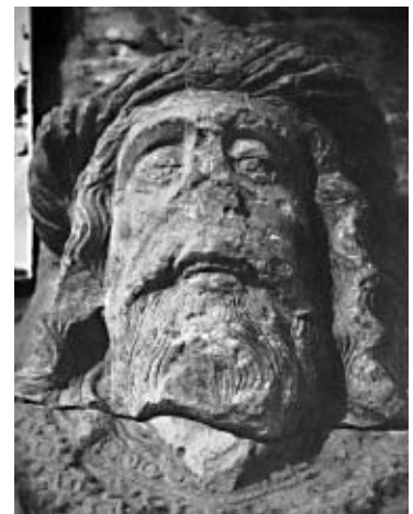
Fig. 24.- Anònim, cap de Nicodem, 1500-1525, Museu Municipal, Agramunt.