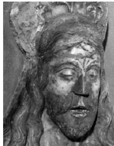
Fig. 26.- Anònim, cap d'un Crist jacent, 1500-1525, Museu Nacional d'Art de Catalunya, Barcelona.