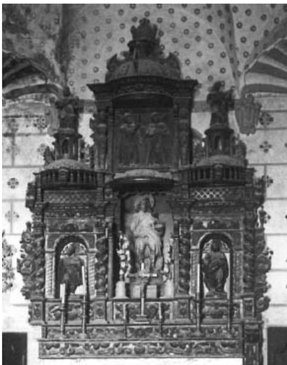
Fig. 8.- Retaule, 1675-1700, capella de Sant Isidori, Mollerussa.