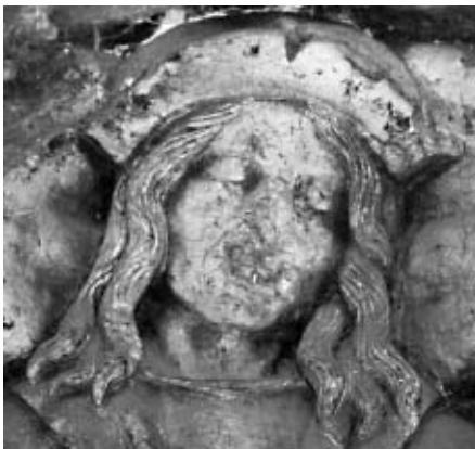
Fig. 25.- Anònim, cap de Ferran de Juara, lauda sepulcral de Ferran de Juara i Timbor de Cabrera, cap a 1520, església de Sant Salvador, Breda.