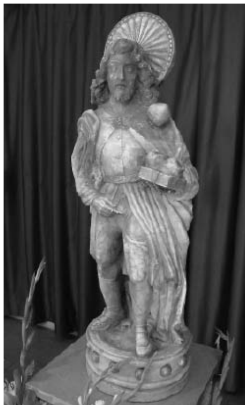
Fig. 9.- Anònim, sant Isidor de Quios, 1500-1525, capella de Sant Isidori, Mollerussa.