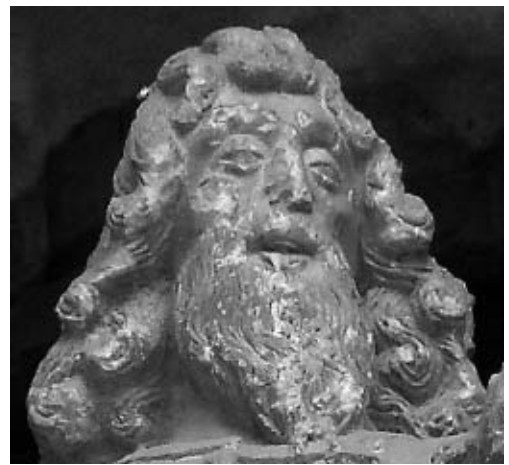
Fig. 23.- Anònim, cap de sant Joan Baptista, 1500-1525, església parroquial, Agramunt.