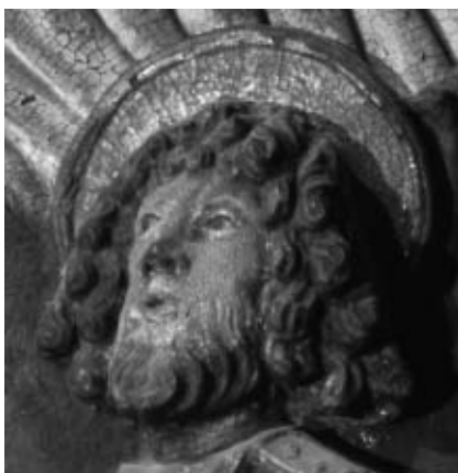
Fig. 20.- Michael Lochner, cap de sant Joan Baptista, retaule de Tots Sants, 1489, Museu Capitular, Barcelona.