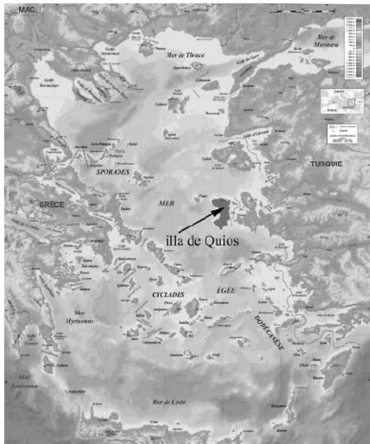
Fig. 2- Mapa del mar Egeu, amb l'illa de Quios assenyada. (Elaboració: J. Y.)