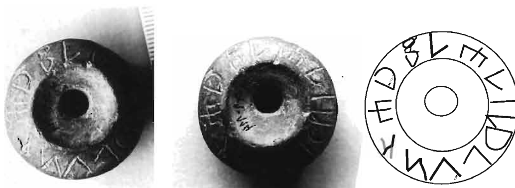
Figura 2. Tortera amb inscripció ibèrica del poblat ibèric de Margalef (Torregrossa) (Ferrer 2008).

El poblat de Margalef, també descobert pel col·lectiu La Femosa, ha gaudit de dues excavacions: la primera duta a terme pels descobridors i la segona, reglada i dirigida pel professor J. Maluquer de Motes l'any 1975. Les intervencions no van exhaurir el jaciment i, a l'espera d'una futura excavació, el jaciment presenta una cronologia entre el període ibèric ple i final (s.IV-II aC). El jaciment és especialment conegut per la quantitat i qualitat dels materials ceràmics, 4 amb algunes formes singulars com els vasos zoomorfs (Junyent 1972a; Vilar 1994; Prados 2004) 5 i especialment pels vasos importats amb vernís negre (Junyent 1974; Principal 1996). 6