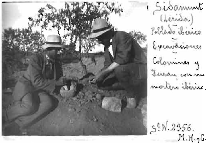
Figura 3. Excavació del Tossal de les Tenalles (Sidamon) amb A. Duran i Sanpere i J. Colominas amb un morter de pedra.