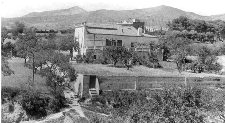
Casa i terres de Can Geroni en una fotografia de l'any 1951. La imatge està presa des de l'actual carrer de la Tudona.

Segons les consultes fetes al Registre de la Propietat, la finca pertanyia en aquella època a l'advocat de Barcelona, Vicenç Rius Roca. El seu possible parentiu amb Isabel Soler no s'ha pogut acreditar, així com tampoc la seva residència o relació amb el carrer de la Sala.