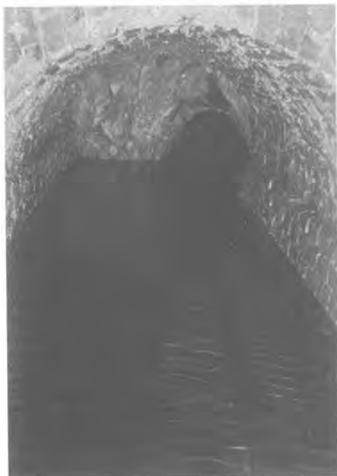
Interior de la mina occidental de can Coscoll.

A l'oest de la masia, tot just al costat del camí, es troba la portella d'aquesta mina. Franquejant-la, trobem una sala rectangular, que generalment està inundada, i una curtíssima galeria situada al final d'aquesta.