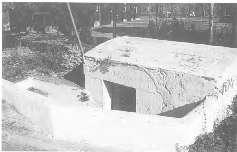
Estat actual de la caseta de registre situada a tocar de la ITV

Ja sota l'avinguda de la Riera, la mina segueix fins a arribar a l'alçada de la moderna planta de la Inspecció Tècnica de Vehicles (ITV), al costat de la qual, en una petita illa enjardinada, encara es conserva una caseta de registre que duu gravada la data de 1795 a la llinda de la portella, que dona pas a un repartidor.