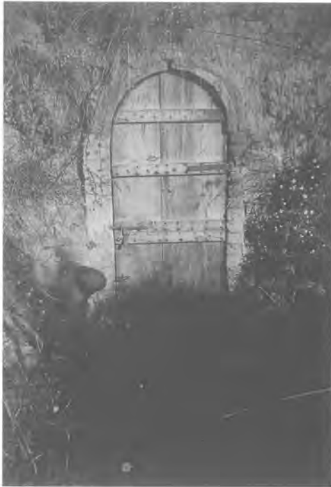
Porta de fusta que dona accés a la mina de ca n'Oliveres.