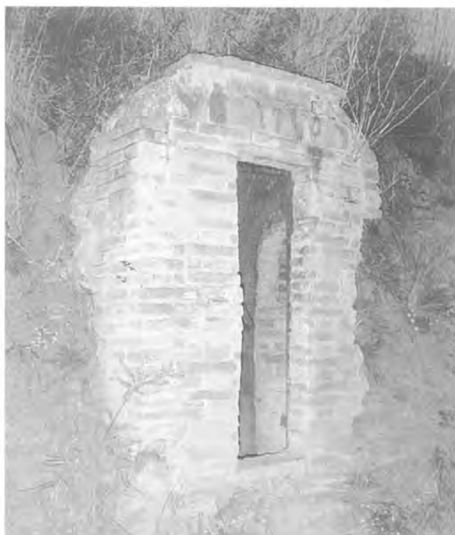
Boca d'accés al ramal del torrent Bo.

Poc més avall, la galeria descriu un brusc gir a l'esquerra i es precipita per un pou de vuit metres cap a un nivell inferior. Aquest nou sector, regat constantment per la cascada que baixa pel pou, és el que presenta els fenòmens reconstructius de major envergadura de totes les mines santjustenques, amb llargues estalactites que sobrepassen els set centímetres de gruix.