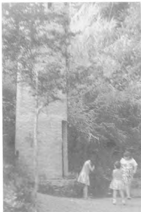
Torre de la font de la "Xima".

Al fons d'un petit pla situat davant l'entrada de can Marlès es troba un safareig al costat del qual hi ha un pou rematat per una torre cònica de maons. Ens ha estat comunicat que al fons d'aquest pou arriba una galeria de mina que segueix el curs del torrent que baixa de can Cuiàs.