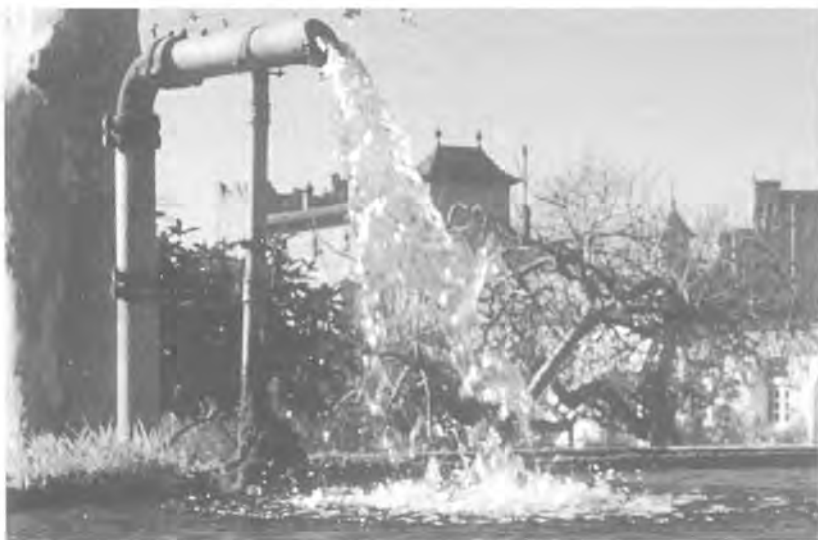
Arribada de l'aigua de la mina a la finca de ca l'Erasme.

Sector topografiat: .....1.701.80 metres.