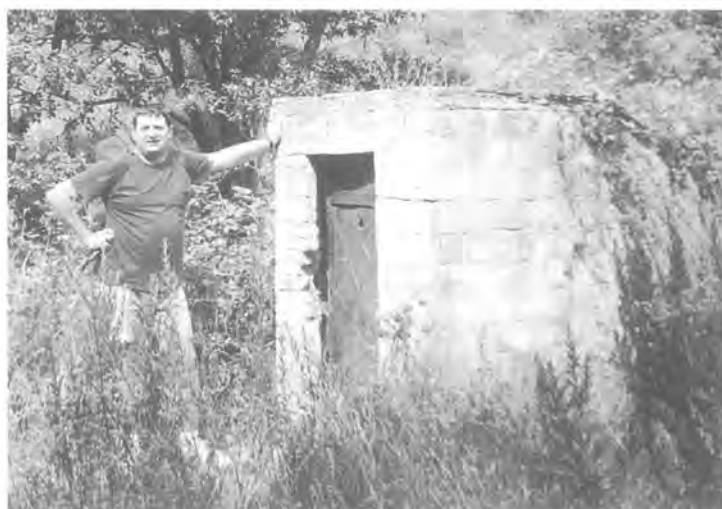
Caseta de registre que accedeix al sector inicial de la mina de Les Fatjones.

En aquell indret, una caseta de maons, generalment coberta de bardisses, constitueix el registre d'entrada. Quan franquem la seva portella i davallam unes escales, trobem una galeria força malmesa que va a incidir prop del sector del floreig. Ja a la galeria principal, si la seguim aigües avall, trobem un salt d'aigua fet a costa d'un pou de buidatge, que ens duu a un nivell inferior.