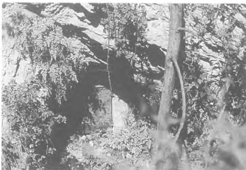
Clotada de la font del Moro.