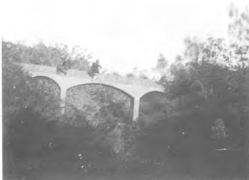
Aqüeducte, avui desaparegut, que es trobava on ara hi ha el carrer de la Salut.

Al tram superior del carrer de Bonavista, a l'alçada de l'antic Pou de les Ànimes, trobem un nou tram de galeria, actualment inaccessible.