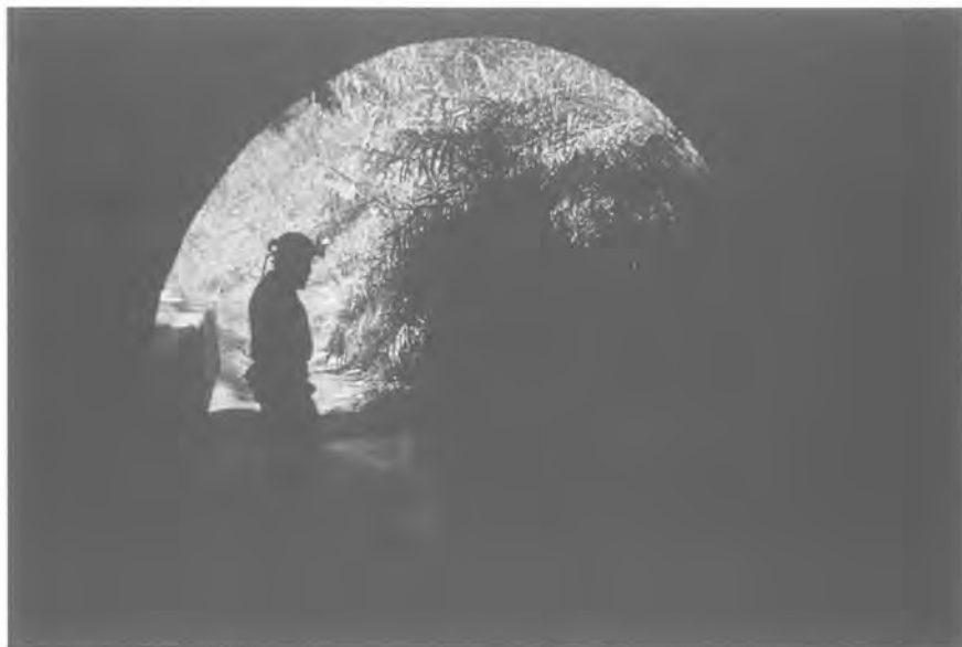
El col·lector de la riera de Sant Just on desguassen les aigües de la mina de la Bonaigua.

Com sigui, el xiringuito, la font i els seus voltants van continuar sent lloc de trobada i esbarjo per a molta gent fins a entrar als anys setanta.