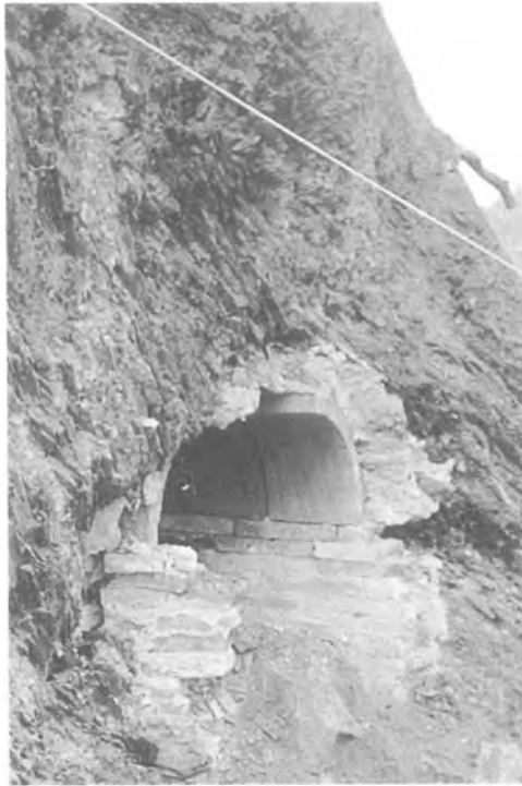
La mina Vidal tallada a la carretera de la Muntanya, amb motiu d'unes obres, a l'alçada de l'Institut de Batxillerat.