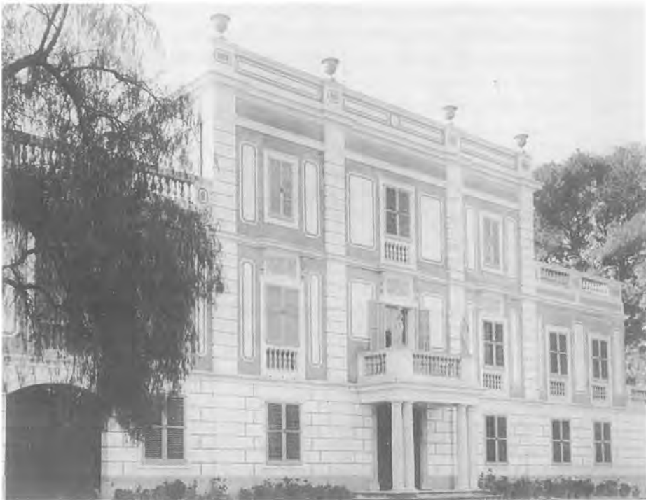
La desapareguda mansió de can Rosàs a Esplugues de Llobregat, punt de destinació de les aigües d'aquesta mina.