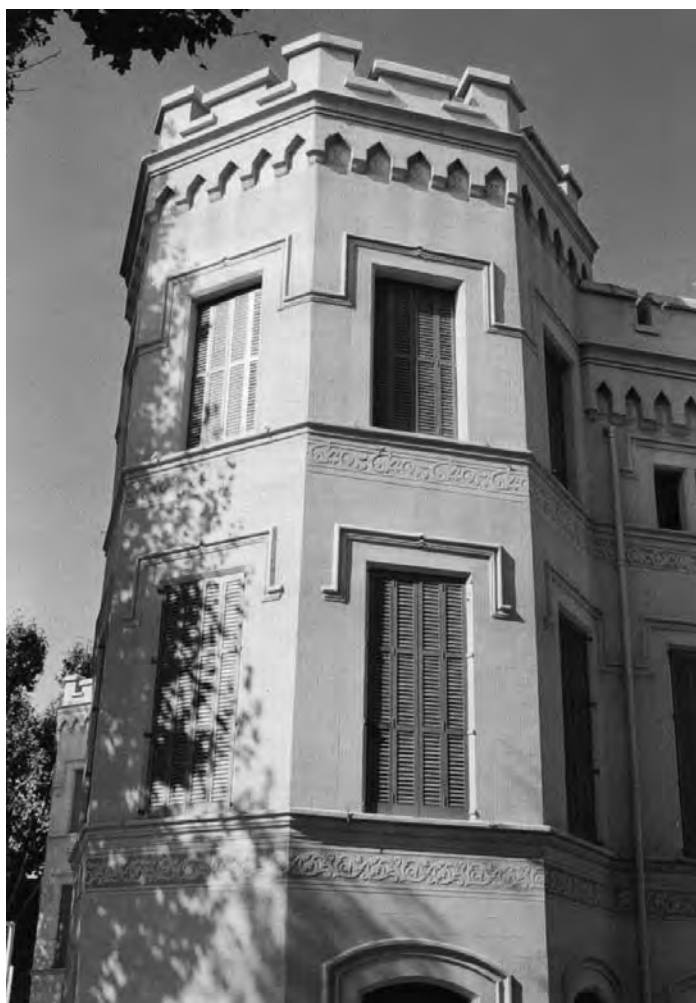
Can Mercader, Cornellà. Estuc amb ciment i voladura de frisos.