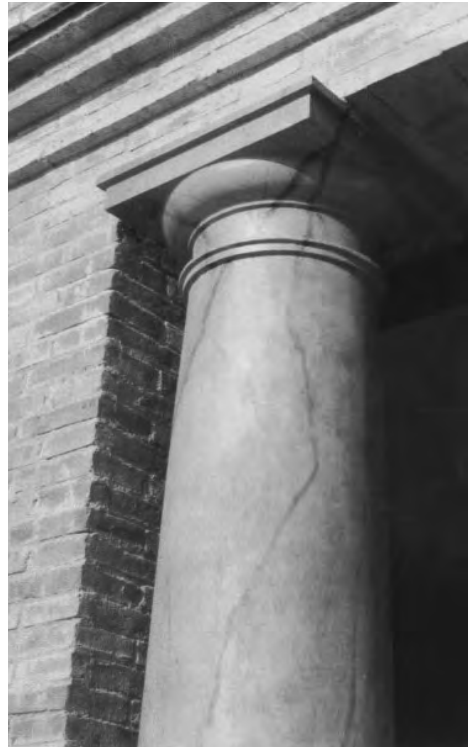
Estuc columna formigó Av. Pearson (Barcelona)

Serà elaborat amb material de calç i arenilla, acabat lliscat ben dur i ben relliscat amb calç. L'última capa de calç i pols de marbre cal que tingui porositat; no passar-hi aigua. La "llet" de la calç és necessària pel pintat que s'ha d'acabar en "tendre".