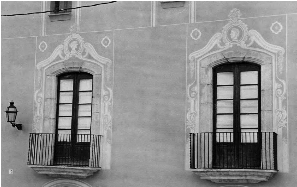
Cal Mercader, Torredembarra. Estucat a calç i esgrafiat.

Entrem en matèria professional per conèixer detalls, petits grans secrets de la professió d'estucador. D'antuvi, el material principal per l'estucat és la calç, junt amb l'arena de marbre, des de granada a fina, passant per pols sempre blanca. La calç millor cuita amb llenya i, si pot ser, del Lledoner (que prové del forn de l'Ordal). Segons quin sigui el gruix de l'estuc, la càrrega de gra serà més elevada; normalment, per tres quarts de bidó de calç hi barrejarem 120 quilos d'arena. La tonalitat del color serà sempre superior al cinc per cent de la mostra per la pèrdua que tindrà quan s'assequi a la paret. La col·locació de l'estuc és aconsellable si l'arrebossat no és nou. Cal passar-hi aigua o rascar-lo si no és correcte. Atès el cas que el gruix de l'estuc sigui superior a tres centímetres es pot reforçar amb griffi o portland.