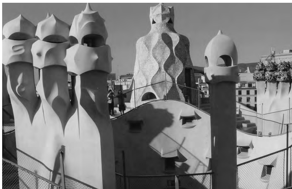
Cares i escales de la Pedrera, Barcelona.