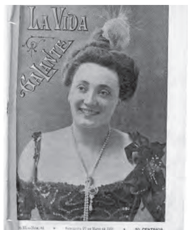
Portada Revista Vida Galante, 1900