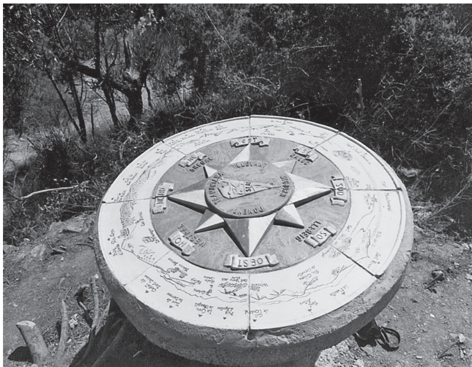
Rosa dels vents original, feta amb peces ceràmiques esmaltades, col·locada l'any 1981 al cim del turó de la Penya del Moro (Collserola).