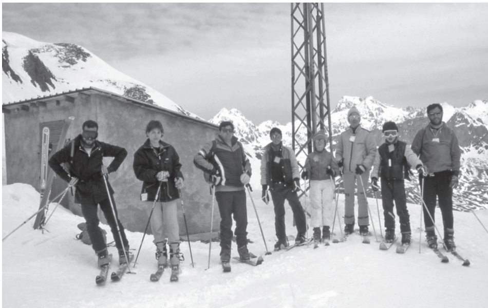
Alguns esquiadors de la Secció a l'estació aragonesa del Formigal l'any 1986.