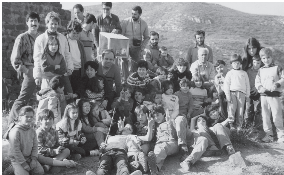
La secció infantil al castell d'Eramprunyà amb motiu de la col·locació del Pessebre de l'any 1984.

dins la Copa Catalana de Ral·lis d'Alta Muntanya i primera Copa de la FEEC, i queden en segon lloc en la mateixa categoria de la Copa d'Espanya.