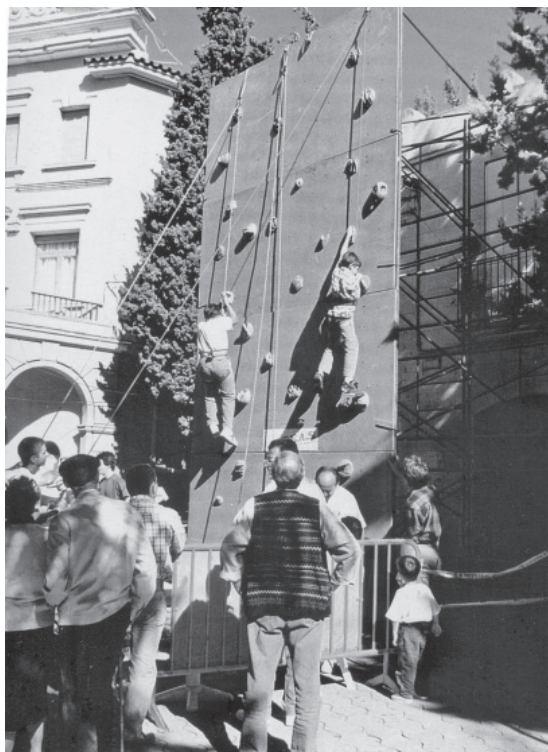
Rocòdrom desmuntable instal·lat per la SEAS al costat de l'edifici de l'Ajuntament durant la festa de Sant Just al Carrer de l'any 1995.

En l'assemblea del 17 de febrer de 1990, el grup d'esquí «Flic-Flac» demana integrar-se a la SEAS, però s'explica que aquest grup està enfocat com a empresa d'activitats amb ànim de lucre, motiu pel qual es decideix desestimar la proposta d'ingrés. En la mateixa assemblea es comenta que pràcticament no es lloga el material i es proposa que a partir d'ara no se'n cobri el lloguer als socis de la Secció, únicament es demanarà que es dipositi una quantitat en concepte de fiança.