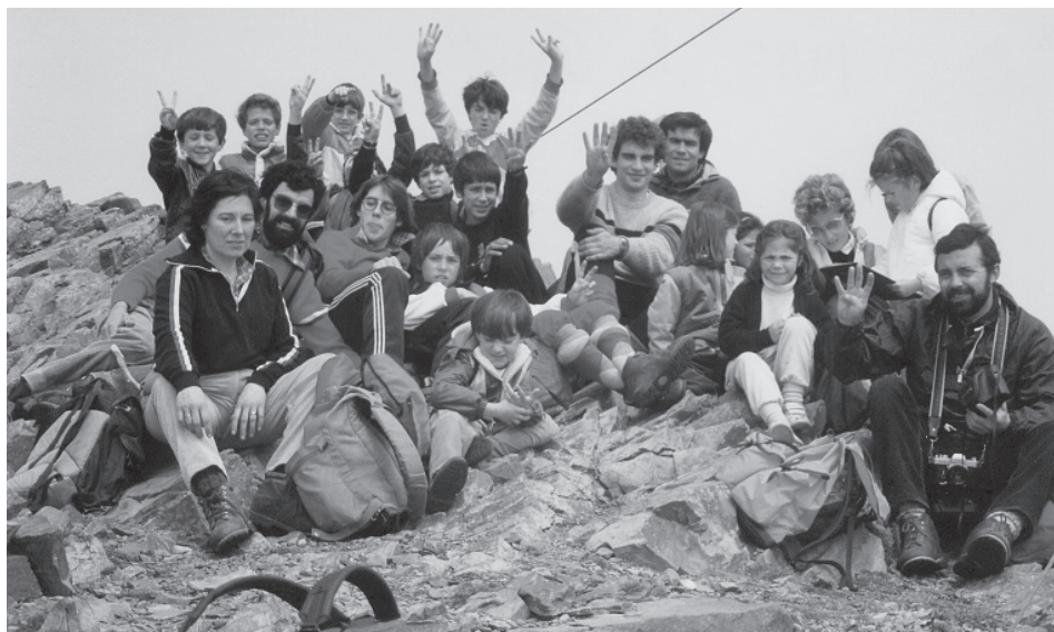
La secció infantil amb alguns dels seus monitors a les Agudes del Montseny, l'any 1985.