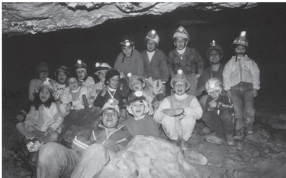
La secció infantil de l'any 1987 en una visita organitzada conjuntament amb el GERP a les coves de Castellolí.

entitat independent— de la SEAS, a causa de la manca d'estatuts actualitzats tant de l'Ateneu com de la SEAS.