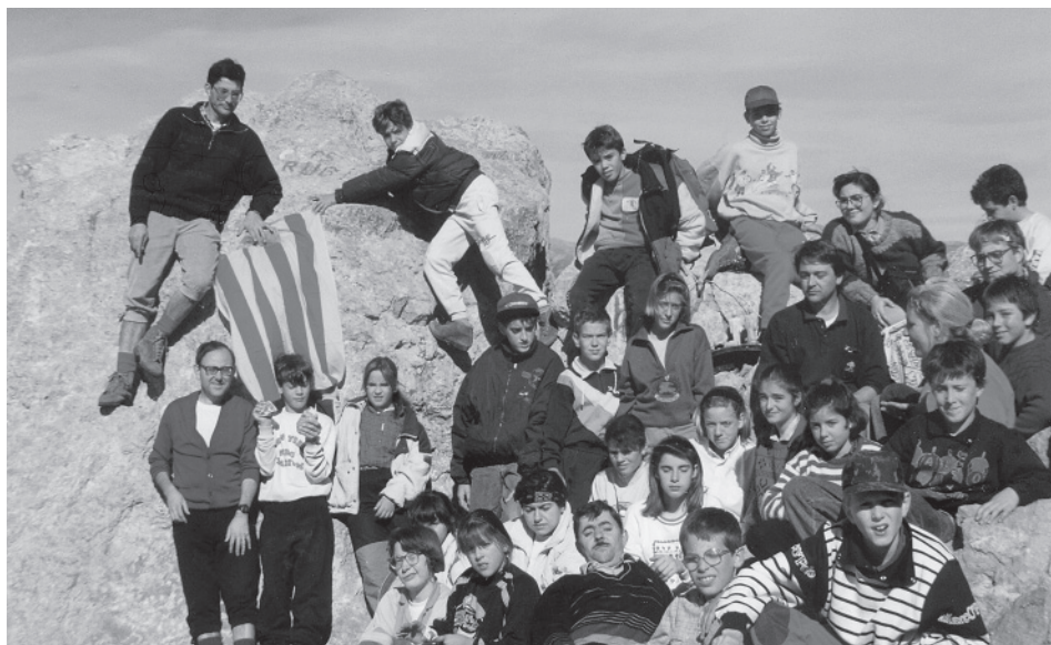
Membres de la secció infantil, amb alguns dels monitors, al cim del Pedraforca l'any 1990.

bàsiques d'organització d'un esplai, fent èmfasi en la dinàmica de grups i en la gestió econòmica. El curs ha costat la quantitat de 60.000 pessetes, però ha estat ben aprofitat, tenint en compte el rendiment que n'han tret aquests nois.