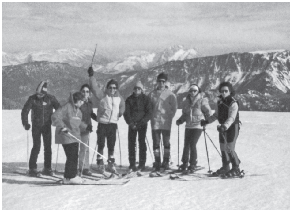
Membres del grup d'esquí de la SEAS - INDO.