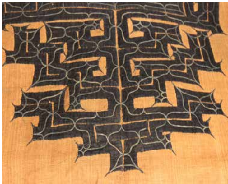
Figura 14. Attush d'obyō atribuït a Peramonkoro, ca. 1947. Visió frontal i decoració posterior. Successió Serra.

i l' ikupasuy , així com també com a eina de caça i com a utensili per a l'existència quotidiana. D'altra banda, ikupasuy és com s'anomenava l'estri de fusta decorat amb motius gravats o en relleu i fet servir pels homes ainus durant els rituals sagrats. Com que també eren utilitzats col·locant-los sota del nas abans de veure sake en les cerimònies, des dels segles XVI i XVII van començar a ser erròniament identificats com a «aixecabigotis» ( higebera ), tant per part dels japonesos com d'aquells estrangers que en van observar l'ús, també d'Eudald Serra. Tanmateix, aquest objecte no tenia res de prosaic, sinó que, ben al contrari, l' ikupasuy era, sens dubte, l'objecte físic amb una càrrega espiritual més important d'entre tots els utilitzats pels ainus: era l'instrument de pregària que els capacitava per comunicar-se indirectament amb els déus. Com a mediador i intermediari entre els homes ( ainu ) i els déus ( kamuy ), els ikupasuy eren utilitzats en un gran nombre de cerimònies i actes religiosos conjuntament amb un bol lacat i el suport corresponent. Documentats des del segle XVI, els ikupasuy mostraven, com els makiri , una gran riquesa de dissenys que també es fa palesa en els exemplars conservats a Barcelona. Uns i altres presentaven sempre motius decoratius diferents i únics, amb formes acuradament gravades o esculpides seguint motius simbòlics específicament escollits, ja fossin florals, geomètrics o bé animals, com ara balenes, ossos o salmons.