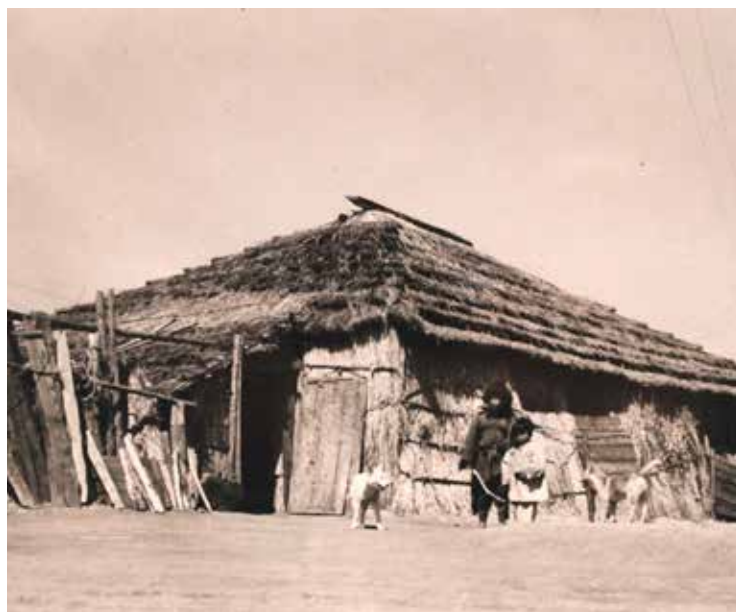
Figura 7. Vista de l'entrada de la casa de Miyamoto ikashmatok amb dos dels seus néts. Shiraoi, 1947. Successió Serra.

anys al Japó. La cultura d'un poble que, malgrat que era història viva del país, havia estat durant molt de temps oprimida i, finalment, aculturada pels mateixos japonesos.