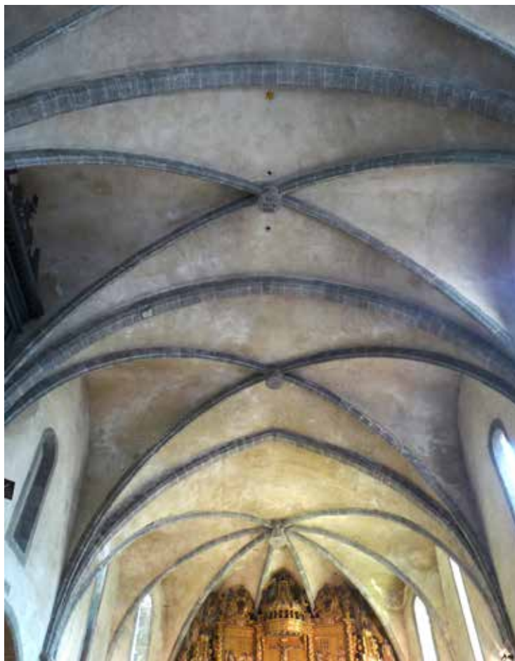
Figure 5. Prats-de-Mollo (Pyrénées-Orientales) : les voûtes de l'église Sainte-Juste et Sainte-Ruffine construites par J. Marial en 1663-64. Photographie : A. Charrett-Dykes, mars 2009.

Au mois de décembre suivant nous retrouvons sa trace à Rivesaltes cette fois, où il est associé à la construction de la nouvelle église paroissiale. Il n'en est pas le maître d'œuvre initial : le nouvel édifice est en chantier depuis 1629, quand la population avait décidé de remplacer l'ancien, devenu trop exigü. Durant la première phase de construction le chantier est conduit