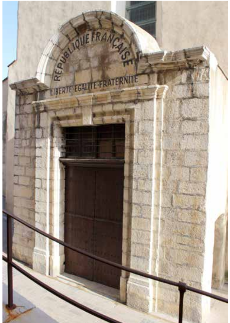
Figure 3. Collioure (Pyrénées-Orientales) : portail de l'église Notre-Dame des Anges, pièce récupérée de l'ancien sanctuaire paroissial ? Photographie : A. Charrett-Dykes, février 2015.

Si les travaux débutent immédiatement, ce second contrat n'aboutit jamais entièrement. En effet, après l'annexion du Roussillon à la France en 1659, l'état-major des armées entreprend de renforcer et d'agrandir les défenses de sa nouvelle frontière méridionale. Dans le cadre de cette campagne les fortifications de Collioure doivent être considérablement augmentées, notamment autour du château royal 31 . Or la réalisation de ce projet implique la démolition de toutes les maisons de la ville haute ainsi que l'église. Dans ces conditions Jaume Marial n'est plus ravitaillé en matériaux et ne peut poursuivre les travaux. Le 15 octobre 1662 un acte vient annuler le second contrat 32 . La démolition de l'édifice intervient dix ans plus tard. Néanmoins le maçon a eu le temps de réaliser une partie des ouvrages demandés, en particulier le portail en pierre de taille, comme il l'indique lui-même dans une déposition en 1680 33 . Plusieurs des témoignages lors du procès du syndic de Collioure contre Marial corroborent cette version, notamment celui d'Antoni Joli, consul de la ville au moment de la fin des travaux. Il indique avoir demandé que soient démontés les blocs de la porte et avoir payé l'un des ouvriers