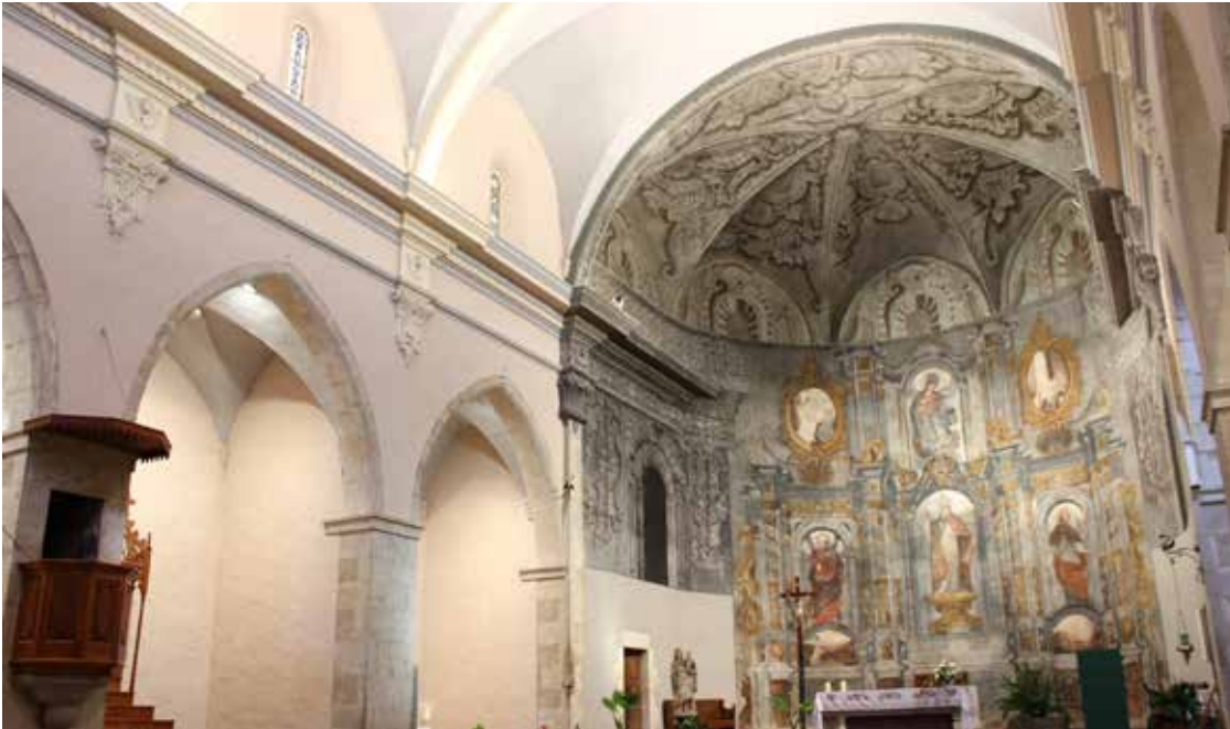
Figure 1. Navata (Alt Empordà) : la nef de l'église Sant Pere (1640-1645).