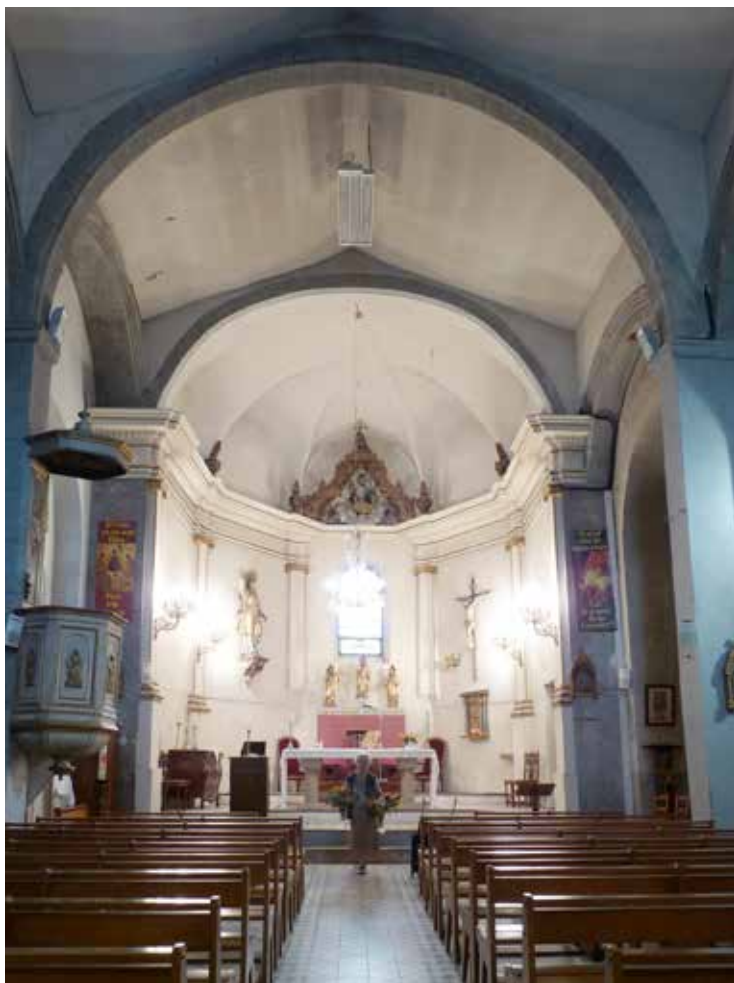
Figure 6. Maureillas (Pyrénées-Orientales) : vue de la nef de l'église paroissiale (1665-1670).