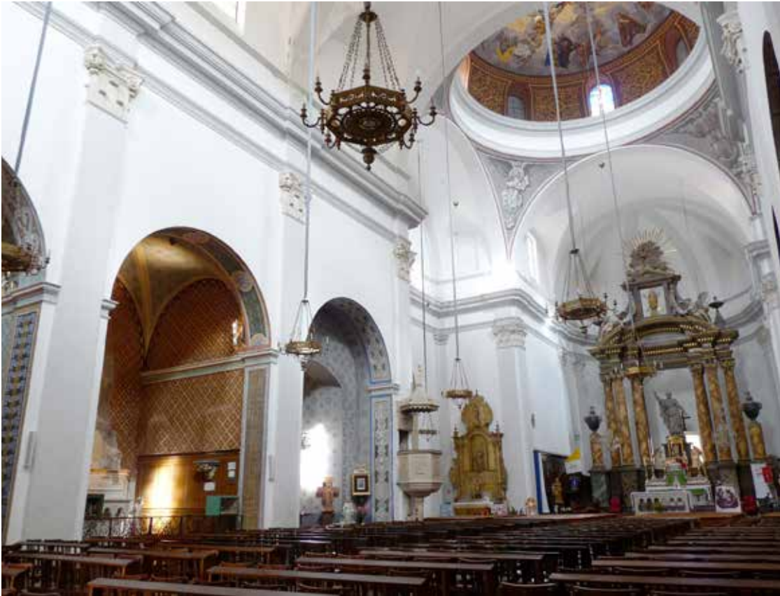
Figure 7. Céret (Pyrénées-Orientales) : vue de la nef de l'église Saint-Pierre (commencée en 1670). octobre 2013.

monter et réédifier les parties défectueuses du clocher, et ce sans percevoir d'indemnité mais évitant ainsi toute poursuite pénale. L'ensemble est définitivement terminé au cours de l'année.