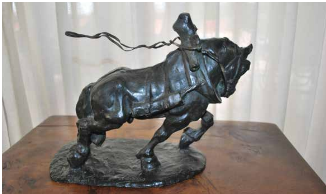
Figura 9. Josep CARDONA I FURRÓ, La pitrada (1909). Col·lecció particular.

d'algun descendent de la persona que la va encarregar, en especial, el cas dels retrats, que es poden guardar com un record de família. Val a dir, però, que, actualment, es poden trobar bastants peces al mercat de les subhastes i dels antiquaris 133 . També coneixem algunes estàtues dipositades a diversos museus de l'Estat espanyol i institucions culturals. Finalment, no ens podem oblidar de l'escultura pública a les ciutats.