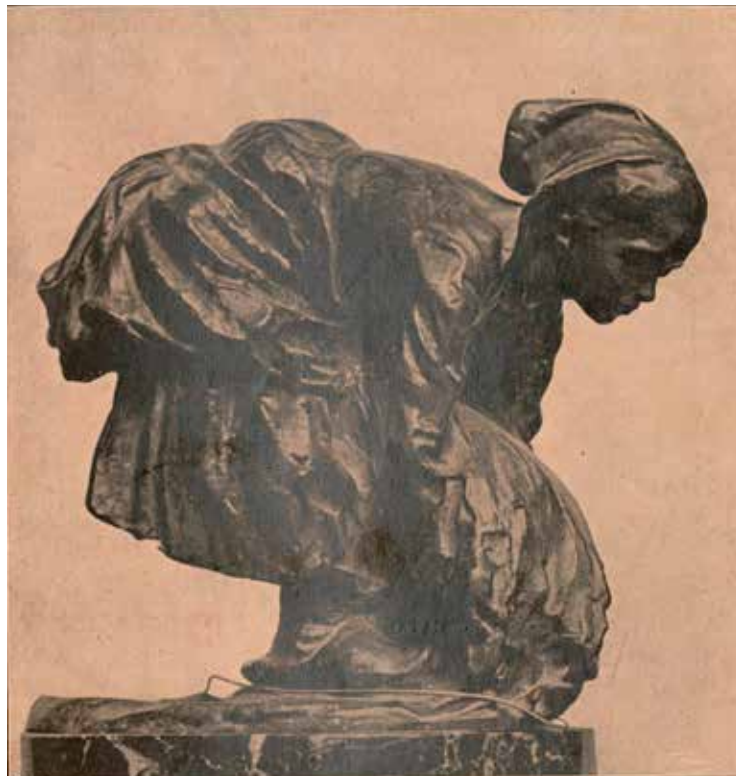
Figura 7. Josep CARDONA I FURRÓ (ca. 1907), «Espigoladora», portada d' Il·lustració Catalana , núm. 741 (26 d'agost de 1917). Arxíu Històric de la Ciutat de Barcelona. Barcelona.