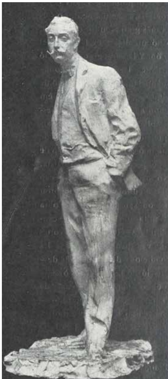
Figura 4. Pavel TROUBETZKOY (s/d), «Retrat d'home». Il·lustració Catalana , núm. 326 (5 de setembre de 1909), p. 510.