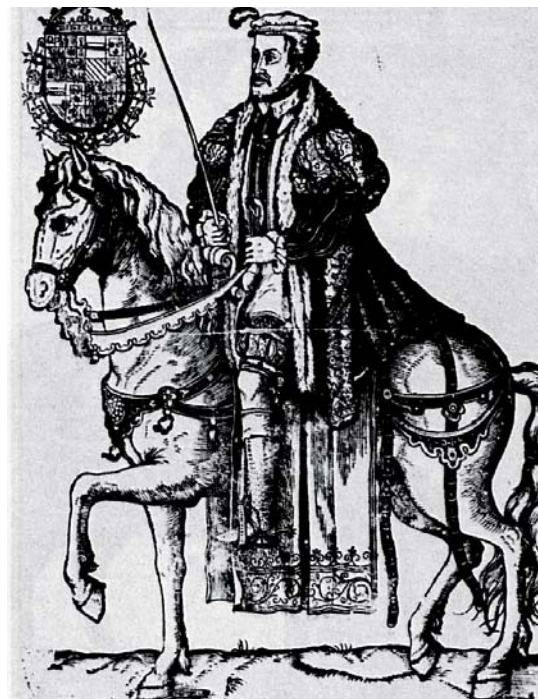
Figura 19. Cornelisz Anthonisz, Ritratto equestre di Carlo V , ca. 1538-1548