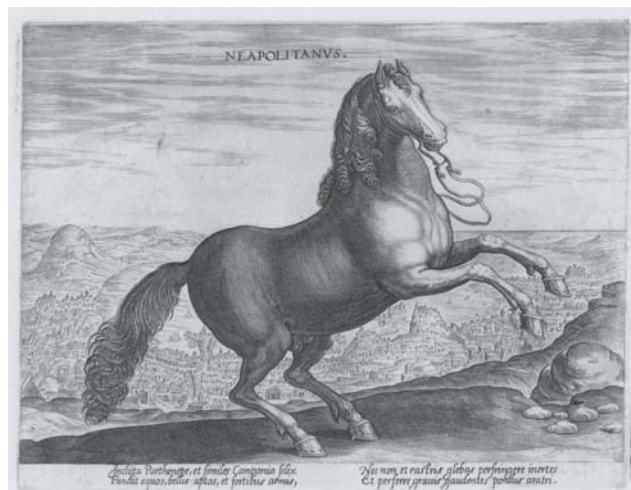
Figura 16. Johannes Stradanus (dis.), e Philips Galle (stamp.), Equus Neapolitanus , da Equile seu speculum eorum , 1580

Modelli dei cavalli velazqueñi, i cavalli dello Stradano sono liberamente raffigurati al passo o in corvette , come i cavalli dei quattro regnanti, su ampi sfondi di paesaggio. Sono inoltre raffigurati secondo le loro razze, i loro caratteri e le loro personalità distinte: ossia attraverso dei veri e propri ritratti , così come i magnifici ritratti equini (autografi integrali di Velázquez) del Salón de Reinos . Ad un attento paragone la somiglianza tra i cavalli di Stradano e quelli di Velázquez (ovviamente in controparte) risulta molto puntuale. Ad esempio, il cavallo di Margherita (figura 3) procede al passo, raffigurato di tre quarti con il garretto sinistro alzato come il cavallo SICAMBER (figura 13), 59 mentre quello di Isabella di Borbone (figura 5), ritratto in perfetto profilo e sempre al passo con il garretto alzato, ricorda nella fisionomia e nella foltissima criniera il cavallo PHRYSO (figura 14), 60 o il cavallo GERMANVS per via dell'identica posa della zampa destra. 61 Il cavallo di Filippo IV (figura 4), ritratto di profilo e in corvette , sembra ripreso dal cavallo CIMBER , anch'esso in perfetto profilo (figura 15), 62 mentre quello di Filippo III (figura 2) sembra modellato sul cavallo NEAPOLITANVS (figura 16) o sul cavallo HISPANVS , 63 entrambi dotati, così come la tela di Velázquez, di un'ampio paesaggio marino sullo sfondo.