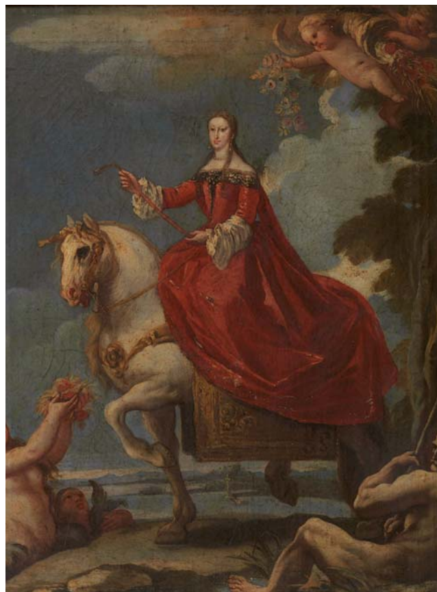
Figure 7-8. Luca Giordano e bottega, Ritratti equestri di Carlo II e Mariana di Neoburgo . Spagna, collezione privata, ca. 1694

spagnoli, con cui Filippo (come tutti gli Asburgo di Spagna), sottolineava il proprio passaggio di ruolo da principe heredero a re, presentando la sua consorte tanto come compagna politica, quanto come unica e devotissima sposa. 32 Ad esempio, la letteratura sull'entrata del 24 Ottobre a Madrid 6 ricchissima e all'interno della stessa gi6 nel 1988 Virginia Tovar Mart6n aveva avuto, per prima, l'idea di abbinare il ritratto equestre di Margherita di Vel6zquez alla documentazione archivistica sulle entrate, senza per6 svilupparlo ulteriormente. 33