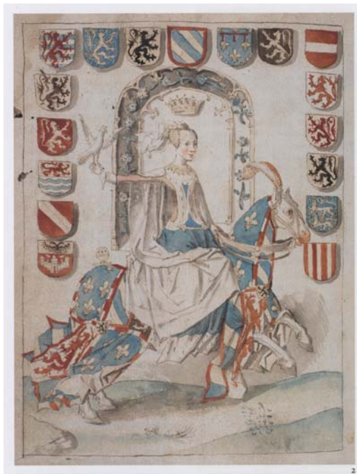
Figura 25. Ritratto equestre della regina Maria di Borgogna, da Excellentie cronike van Vlaenderen , manoscritto della metà del XV secolo