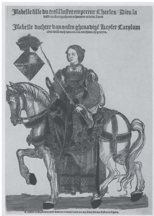
Figura 22. Cornelisz Anthonisz, Ritratto equestre della regina Isabella di Portogallo , ca. 1538-1548