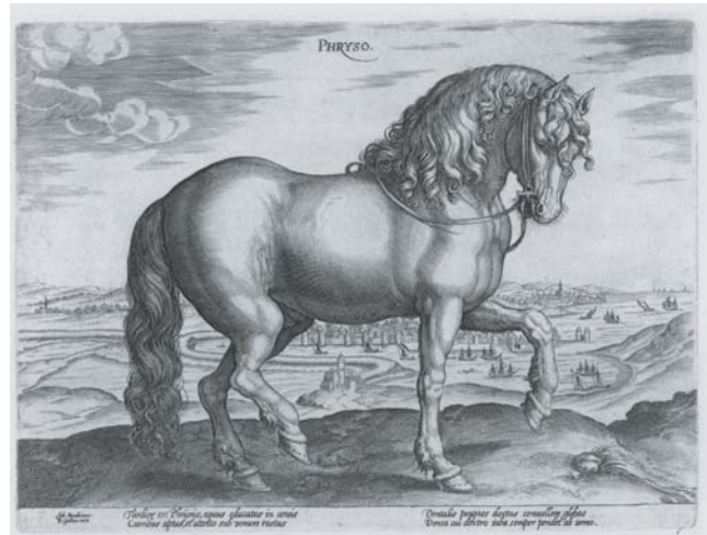
Figura 14. Johannes Stradanus (dis.), Hendrick Goltzius (inc.) e Philips Galle (stamp.), Equus Phyrso , da Equile seu speculum eorum , 1580

sempre vicina al re (senza mai lasciarlo, ma anzi seguendolo dappertutto), era diventata quasi la sua ombra. 53