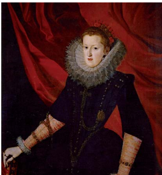
Figura 11. Juan Pantoja de la Cruz, Margherita d'Austria, Regina di Spagna , 1607