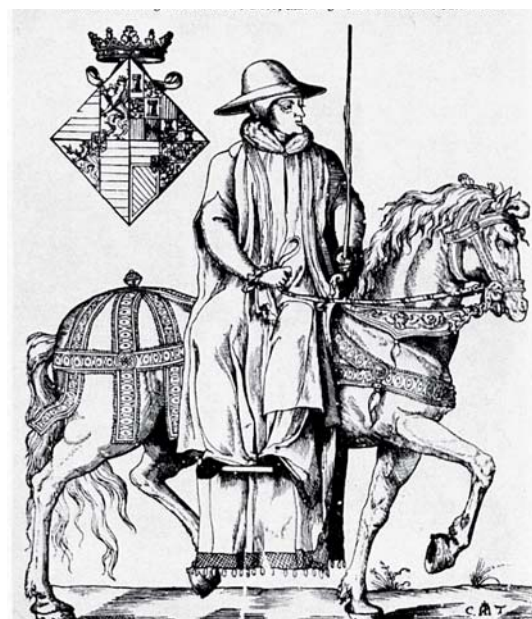
Figura 21. Cornelisz Anthonisz, Ritratto equestre di Maria d'Ungheria , ca. 1538-1548

versa nella prima metà del Cinquecento, autore di numerosi ritratti equestri di vari esponenti di casate nobili e regnanti dei paesi nordici (re di Francia, di Portogallo, di Danimarca, principe d'Orange etc.), ma in particolare di uomini e donne della casa di Borgogna. 65 Nipote di Jacob Cornelisz van Oostsanen, Cornelis divenne famoso come autore di una grande pianta di Amsterdam in dodici rami (1544), ma era soprat-