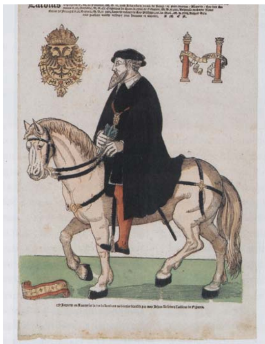
Figura 20. Cornelisz Anthonisz, Ritratto equestre di Carlo V , ca. 1543