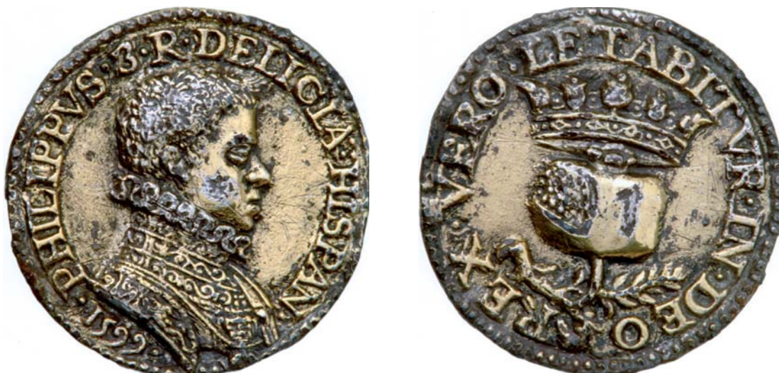
Figura 10. Anonimo, Medaglia di Filippo III (DELICIA HISPANIARVM) , 1599

si a metà faceva cascare due fanciulli recanti in mano le chiavi del regno. 49