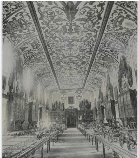
Figura 1. Madrid, Salón de los Reinos del Buen Retiro, già Museo dell'Esercito (Museo de Artillería de Madrid)