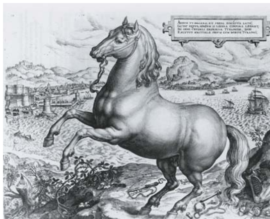
Figura 17. Johannes Stradanus, Il Cavallo Liberato, o Allegoria della Rivolta di Fiandra , ante 1584

L'emblema del cavallo impennato, inteso come metafora di rivolta politica contro la tirannia, sarà usato nuovamente dallo Stradano nella famosa incisione intitolata Allegoria della Rivolta di Fiandra (o Il Cavallo Liberato ) (figura 17): 64 una combinazione di bulino e acquaforte incisa da Hieronymus Wierix prima del 1584 evidentemente collegata alla serie qui discussa e soprattutto al cavallo NAPOLITANVS per via delle allusioni politiche. Considerando che