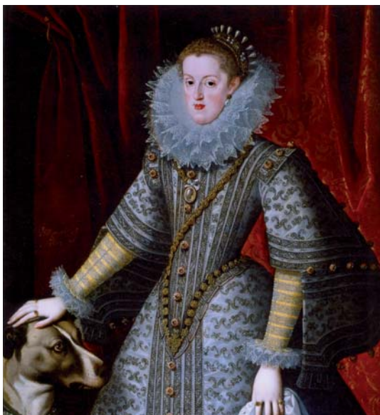
Figura 12. Bartolomé González, Margherita d'Austria, Regina di Spagna , 1609