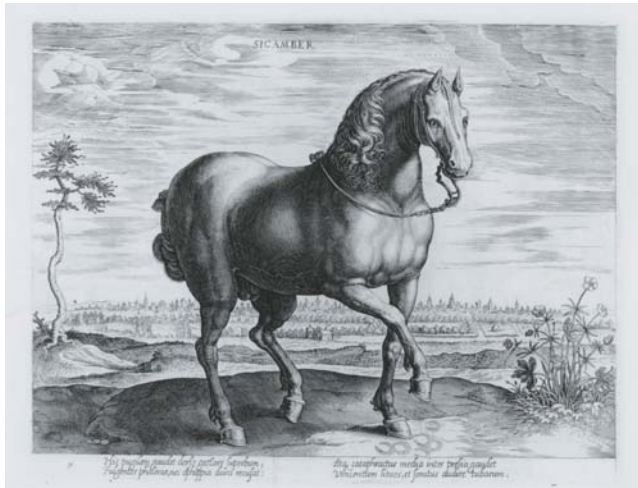
Figura 13. Johannes Stradanus (dis.), Hans Collaert I (inc.) e Philips Galle (stamp.), Equus Sicamber , da Equile seu speculum eorum , 1580