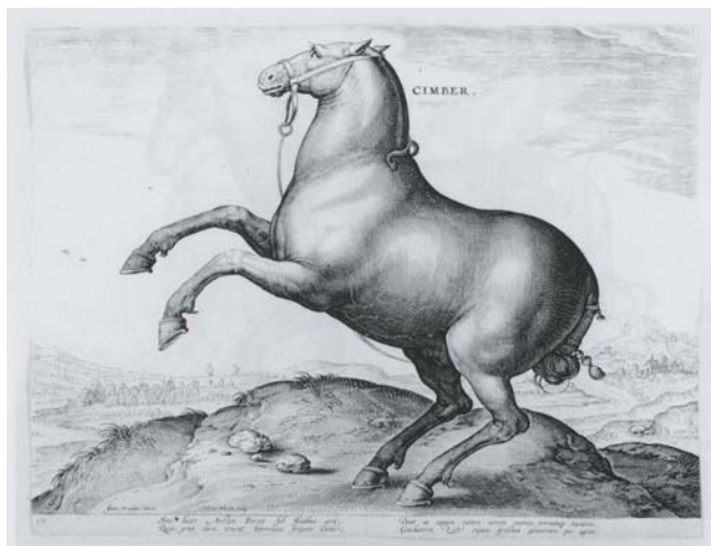
Figura 15. Johannes Stradanus (dis.), Hieronymus Wierix (inc.) e Philips Galle (stamp.), Equus Cimber , da Equile seu speculum eorum , 1585