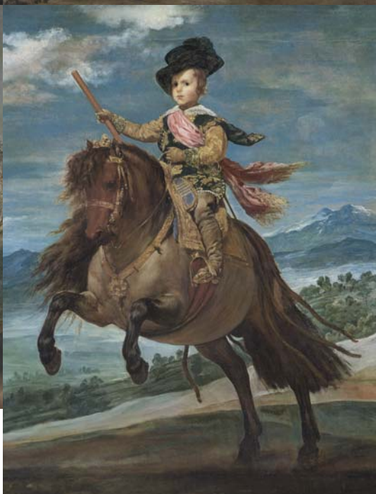
Figure 2-6. Ritratto equestre di Filippo III; Ritratto equestre di Margherita d'Austria; Ritratto equestre di Filippo IV; ritratto equestre di Isabella di Borbone; ritratto equestre di Balthasar Carlos (Madrid, Museo Nacional del Prado, nn. P1176- P1180)