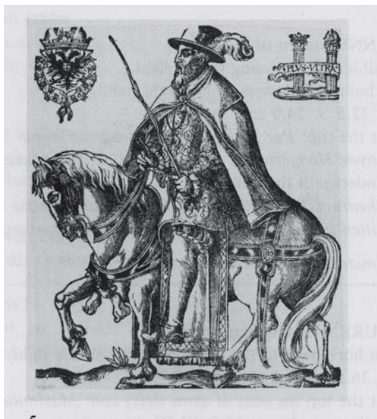
Figura 18. Cornelisz Anthonisz, Ritratto equestre di Carlo V , ca. 1538-1548