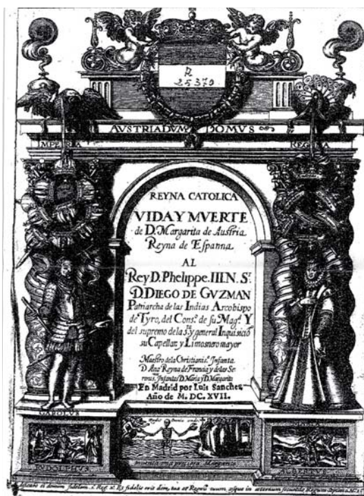
Figura 9. Diego de Guzmán, Reyna Catolica. Vida y muerte de D. Margarita de Austria Reyna de Espana ... , Madrid, Luis Sánchez, 1617, frontespizio

gia equestre venne poi standardizzandosi negli anni successivi, come dimostra la sua rapida diffusione attraverso gli altri ritratti equestri di Velázquez, un grande disegno attribuito a Francisco Ignacio Ruiz de la Iglesia raffigurante Doña Mariana de Austria come reggente e con il bastone del comando al Prado (ca. 1675), 39 la coppia di Ritratti equestri di Carlo II e Maria Luisa di Orleans , dipinti da Francesco Rizzi per l'arco effimero di S. María nel 1679/80 in occasione dell'arrivo della regina a Madrid, 40 e i noti bozzetti di Luca Giordano per due grandi Ritratti equestri di Carlo II e Mariana di Neuburgo (ca. 1694), 41 ora dispersi o secondo alcuni mai realizzati, concepiti per la sua entrata pubblica a Madrid, nel 1690, 42 di cui segnalo in questa sede due copie inedite di ottima qualità in collezione privata madrilenà (figure 7-8). 43