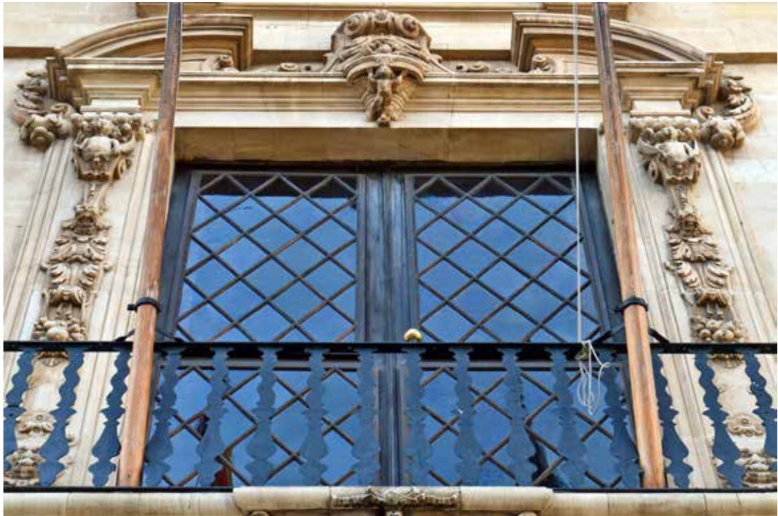
Figura 5. Portal central del pis noble.

estat requerit per treballar en la galeria exterior del Consolat de Mar juntament amb Pere Joan Pinya el 1665 i que la seva experiència es materialitzà en moltes altres obres de decoració arquitectònica i en retaules 35 .