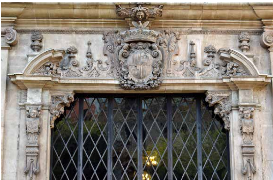
Figura 4. Detall de la tribuna.

sols per conservar la documentació de la Universitat, sinó també per guardar l'arca gòtica de les insaculacions, que servia per triar-ne els càrrecs 29 .