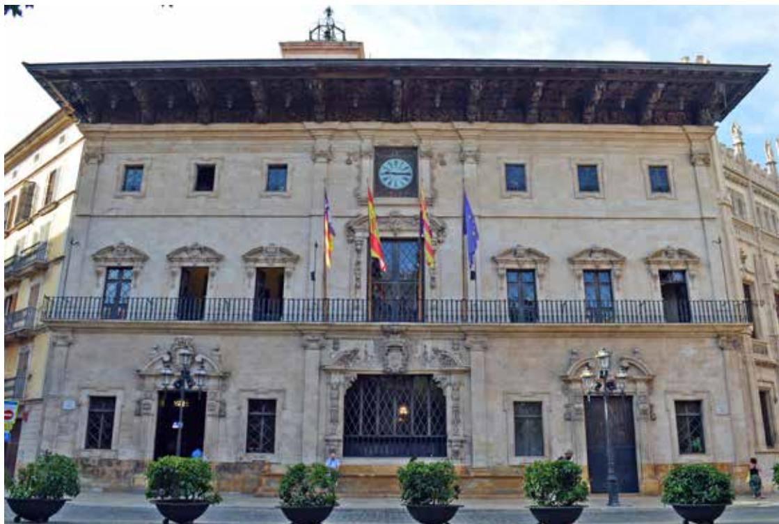
Figura 1. Ajuntament de Palma.

çana es reproduïa sobre postals, fullets i llibrets dedicats als primers turistes. Des de les fototípies de la casa Hauser i Menet fins a les guies il·lustrades de Palma, la plaça de Cort es popularitzà com un lloc que calia visitar. I el 1931 la façana fou declarada Bé d'Interès Cultural amb categoria de monument 5 . A les portes del boom turístic, la guia de Joan Muntaner Bujosa, la guia Costa o els estudis sobre la ciutat de Diego Zaforteza i Pedro Antonio Matheu explicaven la Casa Consistorial amb certa extensió.