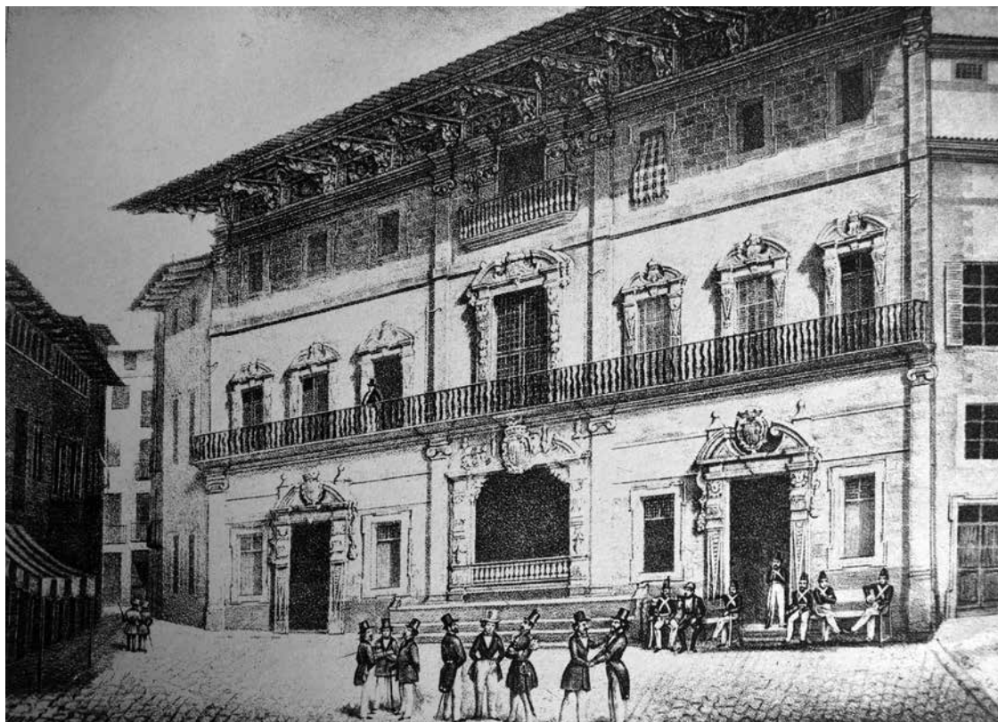
Figura 2. Antonio FURIÓ, Panorama óptico-histórico-artístico de las Islas Baleares , 1840.

permès conèixer detalls dels períodes constructius menys coneguts, així com establir noves hipòtesis sobre el plantejament i el desenvolupament de l'obra.