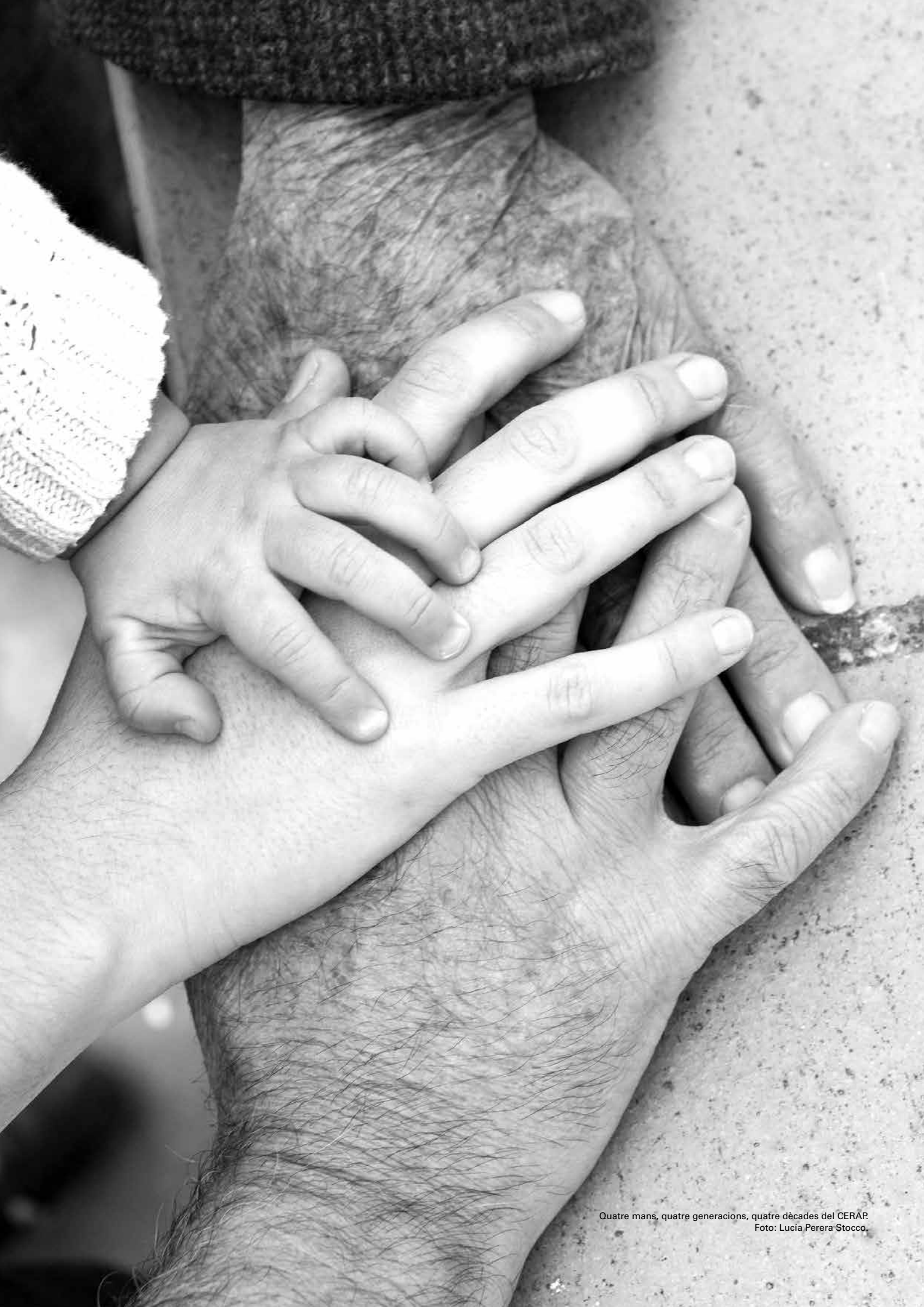
Quatre mans, quatre generacions, quatre dècades del CERAP.