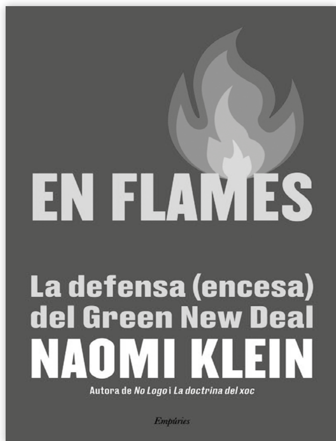
Portada del llibre En flames. La defensa (encesa) del Green New Deal , de Naomi Klein publicat en català per edicions Empúries aquest any 2021.

Així, doncs, tots els esforços s'han de dirigir a la disminució de la petjada que deixen els gasos de carboni al medi ambient, d'efectes catastròfics. En primer lloc, cal que per entomar aquest objectiu emprenguem la lluita amb ambició, i per això cal implicar i animar tota la gent jove del món, ja que el futur i la determinació són seus. En segon lloc, cal demanar més compromís i implicació als líders mundials, que no s'aturin i lluitin. En tercer lloc, Gates reclama un pla més concret lluny de les grans proclames; un pla que ens ajudi a assolir els nostres objectius, clar i pactat entre tots.