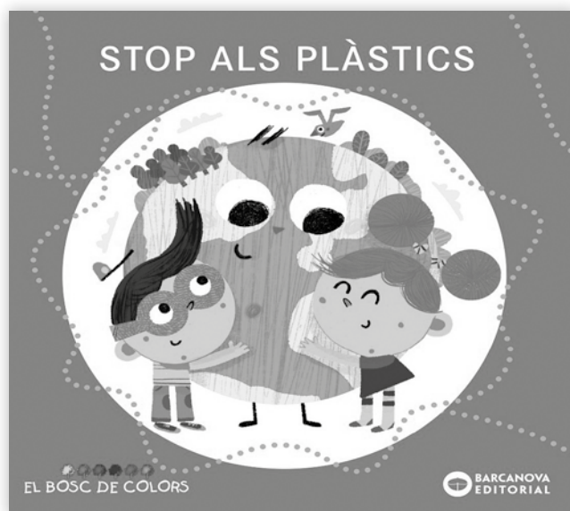
Stop als plàstics , d'Estel Baldo, Rosa Gil i Maria Soliva, i il·lustracions de Muntsa Gonzalez, conte publicat enguany per l'Editorial Barcanova, concretament dins de la col·lecció El Bosc de colors.

Només amb el coneixement adaptat a les diferents edats podem educar en la utilització dels elements derivats de la química que faciliten el confort de la nostra vida però que poden contaminar si no els fem servir amb seny.