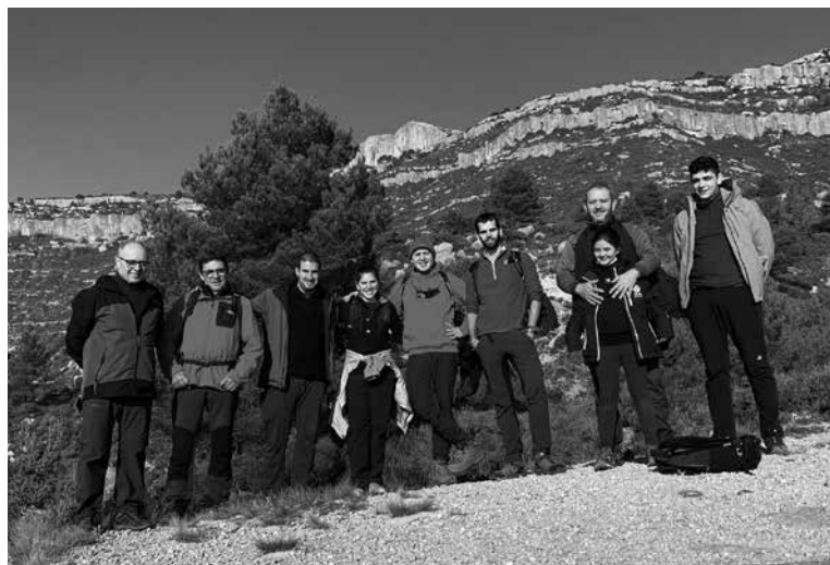
Grup de cerapins que el 19 de desembre van visitar el pessebre que el Centre d'Estudis té instal·lat de manera permanent al Pla de les Tèptacions, al GR-174.

Ara feia anys que no es duia a terme la sortida a Sant Joan de Codolar, pels volts de Nadal, per visitar el pessebre del CERAP. La causa no és només el covid-19 sinó una barreja de falta d'interès i manca de gent per fer l'activitat. Enguany, sí, però, que el 19 de desembre ens vam trobar tota una colla ben aviat a Riudoms per anar plegats fins a Cornudella on vam deixar els cotxes. Allà cap a les nou vam començar a fer camí amb bona fresqueta i molta boira. Tot seguint diferents carrers vam cercar el camí del Bassot fins a trobar l'encreuament