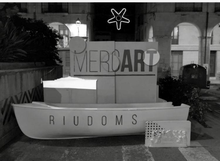
Intervenció artística a la tercera edició del Mercat d’Artistes de Riudoms.

ció s’hi van veure peces de diferents disciplines com el gravat electrolític, la serigrafia, el brodat i l’escultura sonora. El que més va sorprendre el públic va ser la intervenció mural de grans dimensions que va ocupar les parets de la sala del CERAP. El mural es va poder veure durant el mes que va durar l’exposició, i va ser la primera vegada que es va intervenir en aquest espai. Un altre dels protagonistes de la inauguració va ser el concert en directe que l’artista ens va oferir, amb un acordió diatònic digital i diferents sintetitzadors. El resultat va ser una barreja de música folklòrica i música electrònica experimental, que servia de banda sonora per aquesta exposició. El concert es va poder gaudir també el dia 17 de desembre durant una visita comentada amb l’artista, en què ens va explicar el procés de creació de cadascuna de les peces i també de la composició musical. Ambdues activitats van ser un èxit d’assistència, i la Secció d’Art valorem positivament poder oferir nous formats com aquests. »