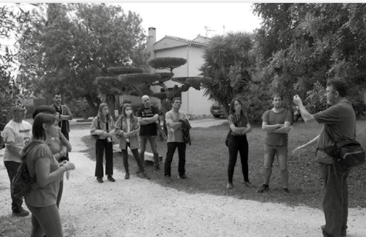
La Secció de Ciències Naturals del CERAP va organitzar una visita guiada al jardí botànic Ecoherbes Park el 2 d'octubre passat.