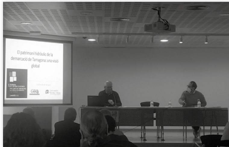
La Trobada de Centres d'Estudis del Camp de Tarragona i la Conca de Barberà d'enguany va tenir lloc el 13 de novembre a Cambrils i, si no hi ha cap imprevist, l'any que ve se celebrarà a Riudoms.

Els dies 27 i 28 de novembre, l'associació d'intercanvis culturals Europe Echanges, amb seu a Normandia (França), ha celebrat una fira exposició de productes locals de diversos països europeus amb els quals té convenis, un d'ells és l'Estat espanyol, on l'únic contacte és amb Catalunya i concretament amb el Baix Camp, amb conveni de col·laboració amb el CERAP. Per tant, els productes han estat enviats a la fira des de Riudoms amb l'especial col·laboració de la Cooperativa de Riudoms, que ha preparat i enviat tots els productes necessaris per poder realitzar l'activitat. En