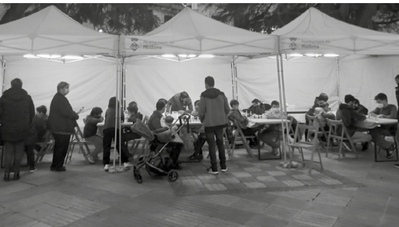
El taller d'escacs que va muntar el CERAP a la plaça de l'Església el 29 de desembre va servir per difondre aquesta activitat del Centre d'Estudis i animar nous jugadors a inscriure's als cursos dels dijous.

l'Unai Bergaretxe Gavaldà (Riudoms, 2008). Amb només 13 anys ha guanyat el Campionat Territorial de Tarragona, que s'ha disputat entre el 2 d'octubre i el 27 de novembre. A l'última jornada, l'Unai Bergaretxe va arribar matemàticament campió ja que tenia un avantatge d'1,5 punts respecte al següent classificat. L'Unai, que va participar al grup B del torneig, amb un total de 49 jugadors federats i partint de la 39a posició del rànquing (segons el sistema de puntuació ELO) va aconseguir un total de set victòries, una taula (Empat) i una única derrota. Cal destacar l'increment de puntuació ELO que ha fet l'Unai durant el torneig, ja que va començar amb 1.658 i a mesura que va anar guanyant partides va incrementar fins acabar el torneig a 1.858. Esperem que continuï tenint molts èxits en la seva carrera com a escaquista.»