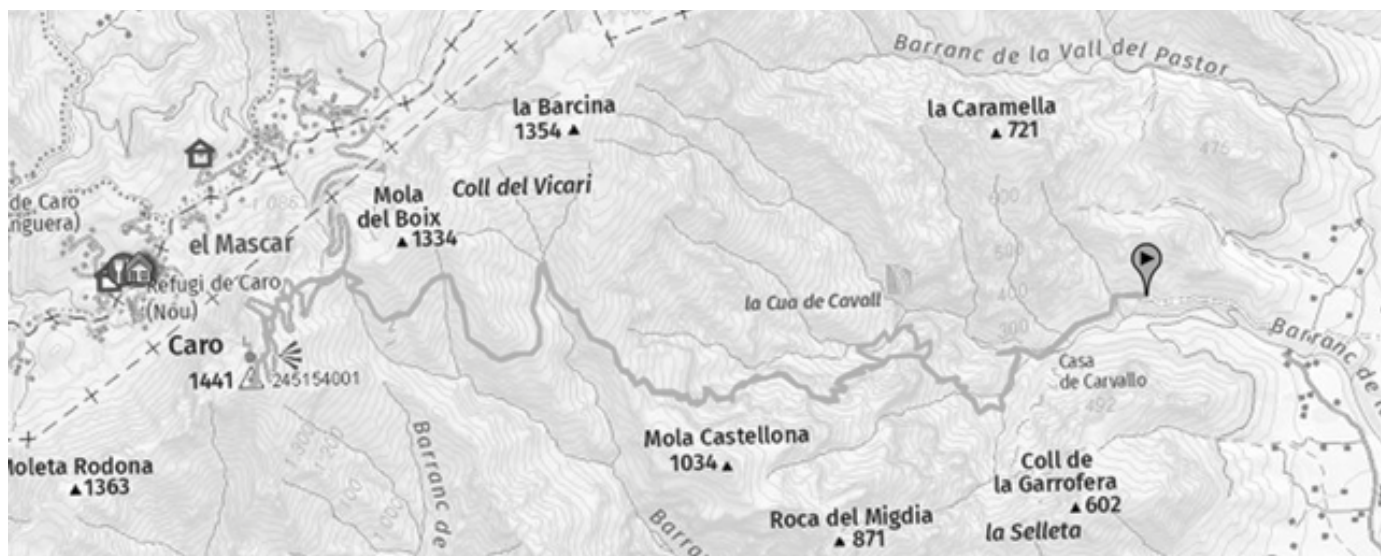
Mapa del recorregut de la sortida elaborat per Ester Barceló a partir dels publicats per l'Institut Cartogràfic de Catalunya.