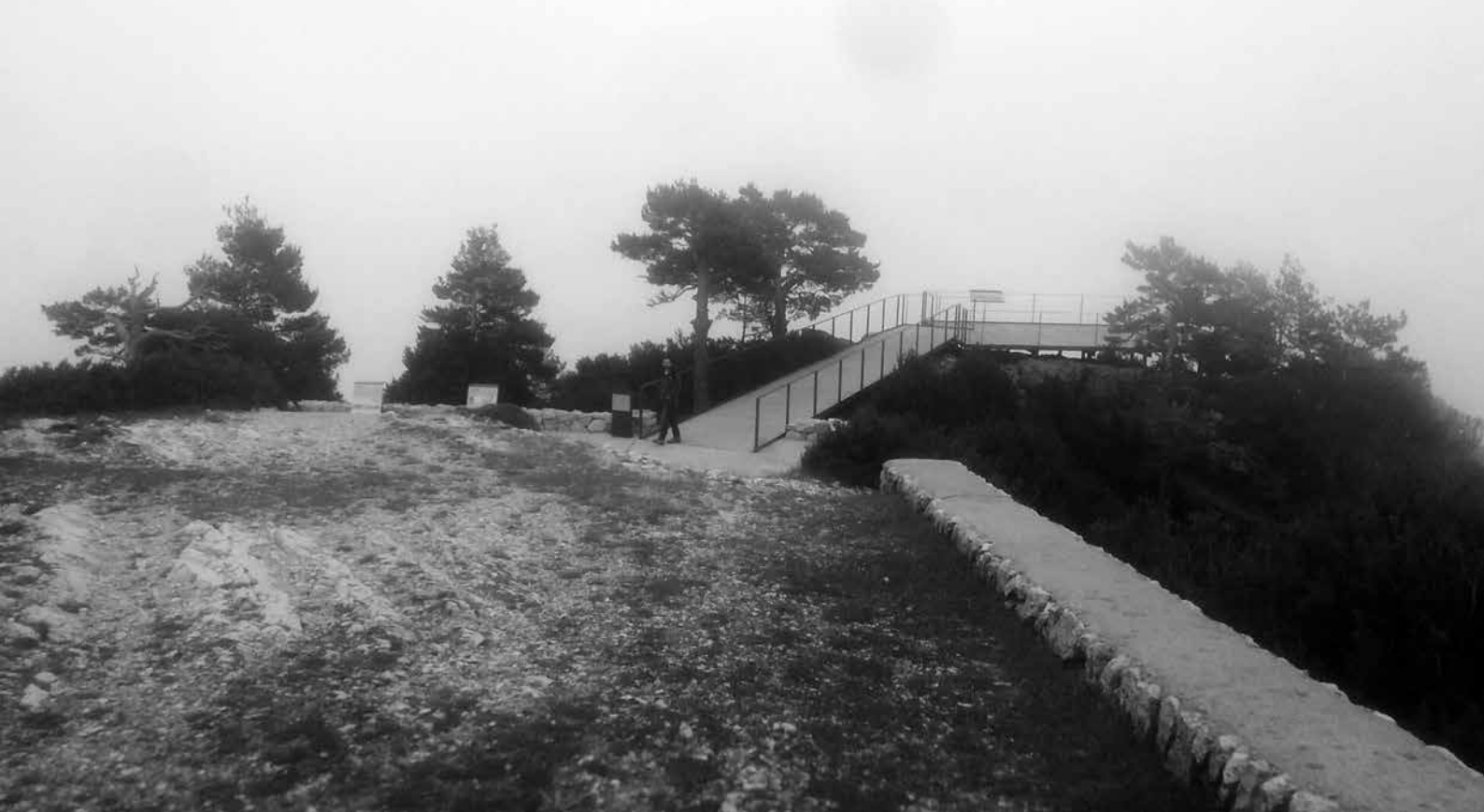
Al capdamunt del cim del Caro hi ha un mirador, que en aquesta imatge està lleugerament cobert de neu i força emboirat.

metres de desnivell positiu des de l'inici a la zona de la Caramella fins al final, al cim del Caro.