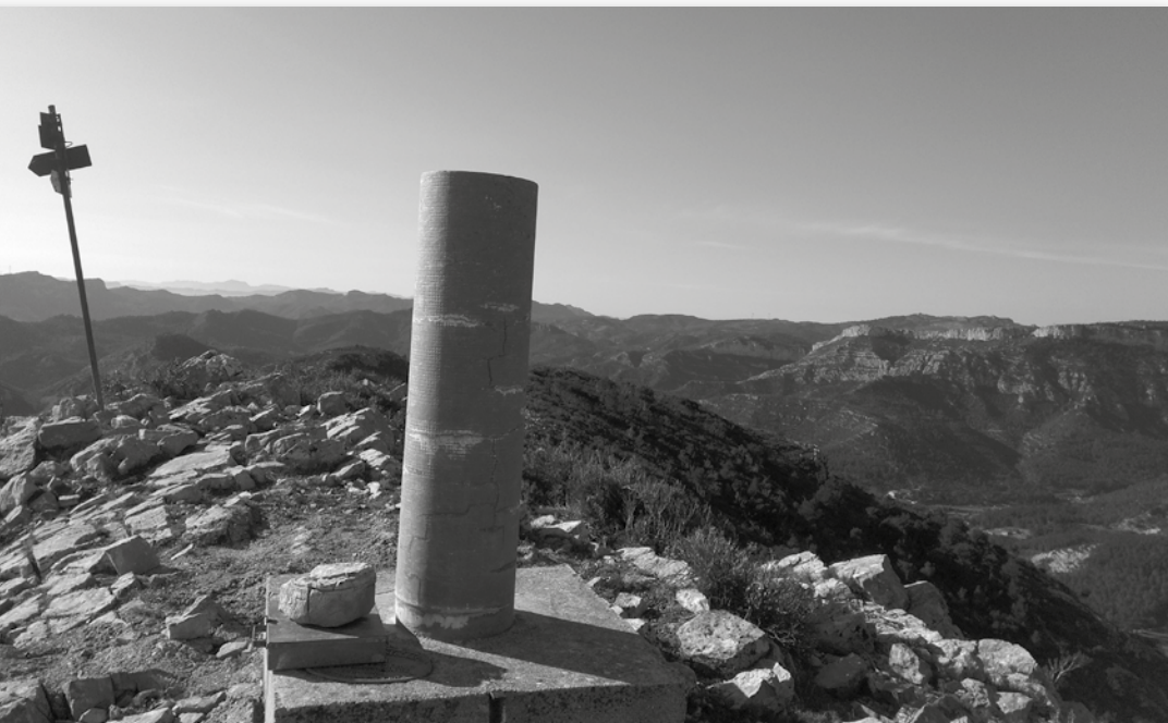
Cim del Puig de la Cabrafiga amb la Serra de Llaberia de fons.

En aquesta ocasió proposem un recorregut circular que ens portarà a assolir el cim del Puig de la Cabrafiga (614 metres), a la part sud-est de la