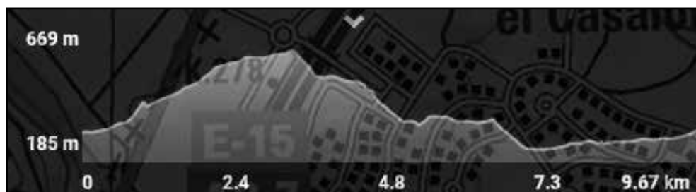
Perfil del recorregut de la sortida proposada en aquest article, al vèrtex geodèsic del Puig de la Cabrafiga.

quants horts que gairebé seran l'últim vestigi de l'activitat agrària al municipi. Només cal ampliar una mica el zoom del que seria la imatge visual del terme municipal de Pratedip per veure amb els nostres propis ulls el que algun dia van ser muntanyes abancalades i que actualment són boscos joves de pi blanc, majoritàriament, que van guanyant terreny cap a les zones més pròximes al nucli de població, les quals són les úniques que a dia d'avui