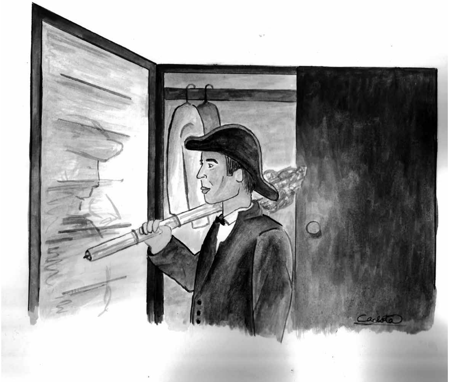
Durant setmanes 2. II-Il·lustració de Carlota Massó Cabré.