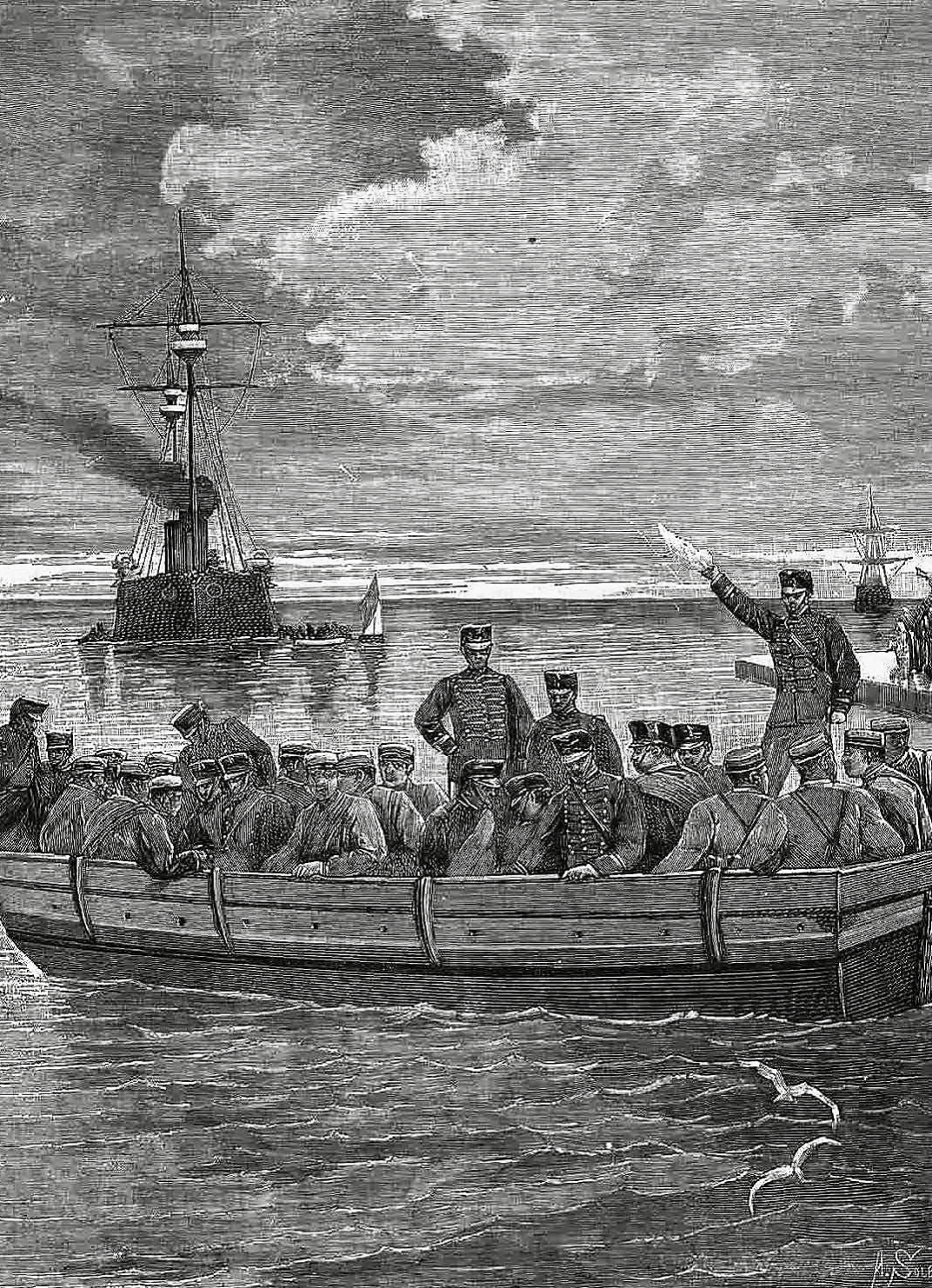
Embarcament de tropes a Cuba.

Dominicana. En aquest document queden exposades de manera clara les causes per les quals el poble de Cuba es llança a la lluita i aclareix també que la guerra d'alliberament no era contra el poble espanyol, sinó contra el règim colonial. Un mes després, el 26 d'abril,