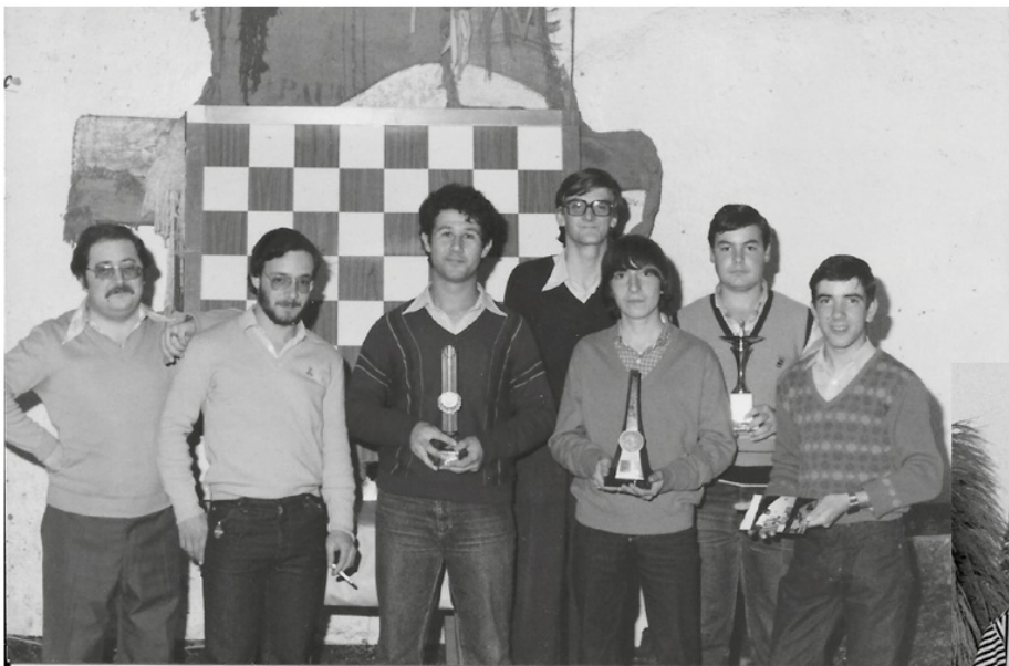
A l'esquerra, organitzadors i guanyadors d'un dels campionats locals d'escacs que va organitzar la Secció d'Escacs del Grup de Joves de Riudoms. Concretament aquesta imatge és del 1982. I a la dreta, VIII campionat local d'escacs «Memorial Enric Cardona» organitzat pel Grup de Joves de Riudoms el 1988.