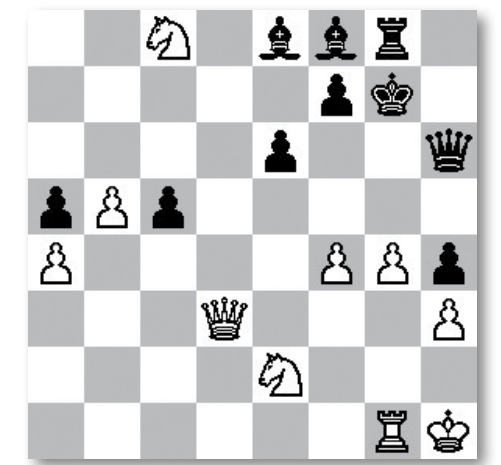
Diagrama 3. Posició després de la jugada 31.