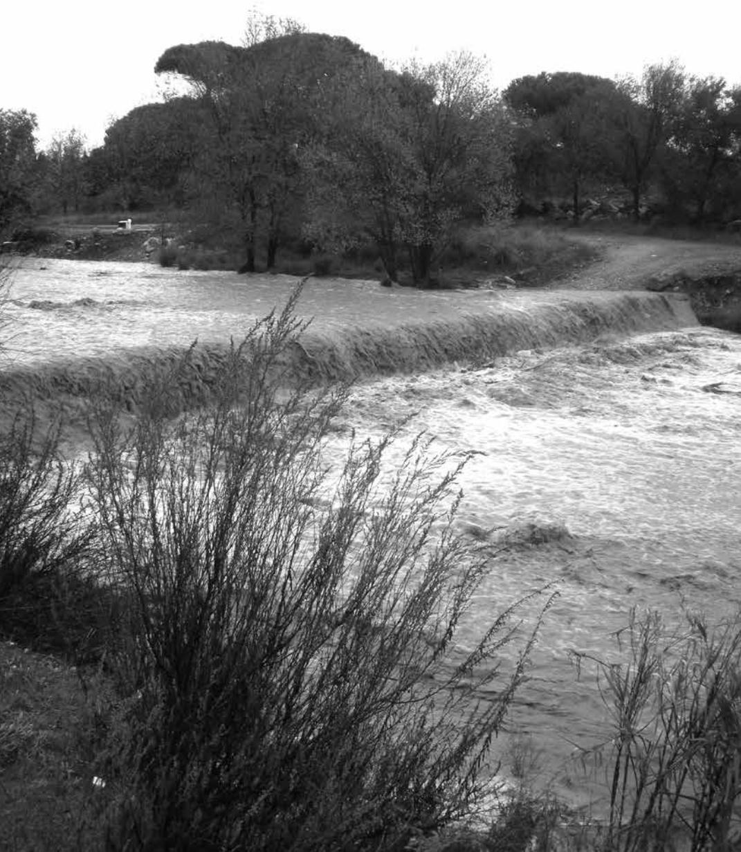
Un afluent de la riera de Maspujols és el torrent de la Ulastrada –l'actual dels Parrots, a la partida del Puig Pedrós–, documentat l'any 1187.

el «castrum» de Tamarit i va constituir el d'Ullastrell, que encomanà a un dels llinatges feudals més rellevants del moment: els Claramunt. Els dos districtes rodejaven Tarragona, però l'acció culminant del procés havia de ser la concessió comtal a Berenguer, vescomte de Narbona, de la ciutat i el comtat de Tarragona, entorn de l'any 1050. El projecte, però, no va quallar.