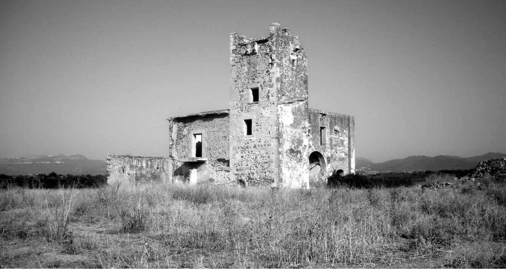
Mas de Don Felip, a la partida del Burgar (s. XVI). El nom al·ludeix al militar Felip de Ferrant, de la família dels ducs d'Almenara Alta.