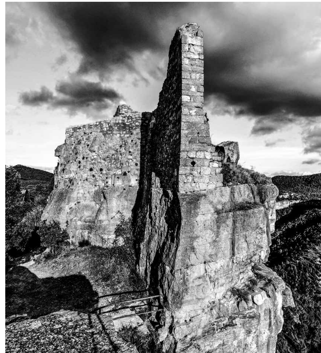
Murs del castell de Siurana, darrer bastió àrab al territori.

3. Una àrea litoral, al sud, entre el mar i la corba dels 200 m, i des del Francolí fins al coll de Balaguer. No hi ha evidències documentals, ni textuales