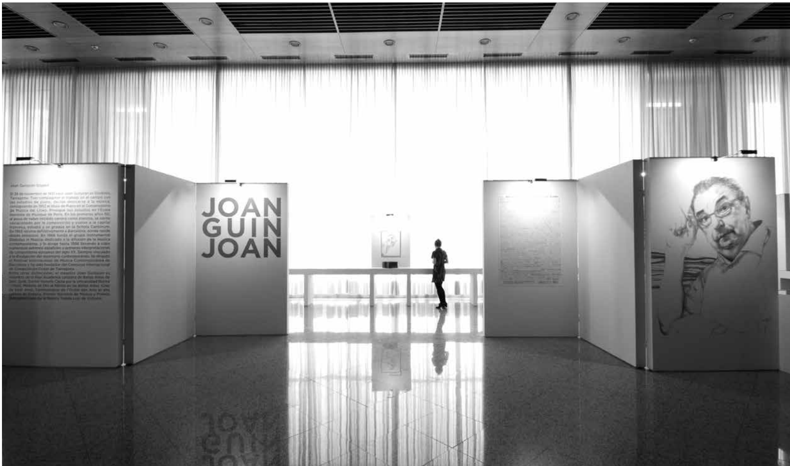
Vista frontal de l'entrada de l'exposició "Carta Blanca a Joan Guinjoan" que va tenir lloc a Madrid l'any passat.