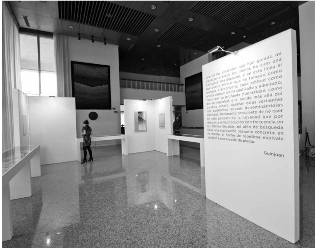
A la dreta de l'exposició "Carta Blanca a Joan Guinjoan" a Madrid.

Concert per a percussió i orquestra , Guinjoan es troba indagant, buscant, trobant i rebutjant nous sons per a noves obres, iniciant els passos següents d'un llarg camí que va començar a Riudoms, fa més de vuitanta anys, d'on va sortir amb la tenacitat, la humilitat, la constància i la fermesa que dóna el treball de la terra, i que l'ha portat a ser un dels compositors indiscutibles del present més universal. »