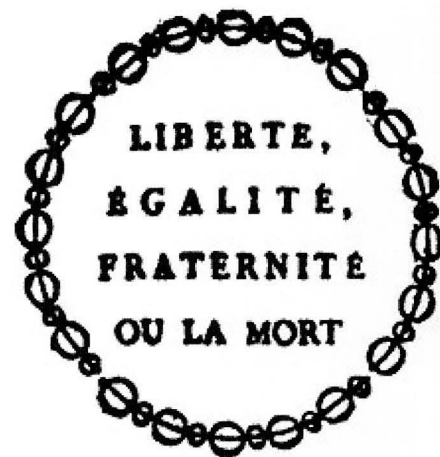
El lema inicial de la revolució era aquest. Posteriorment, "la mort" va ser abandonat per ser massa fortament associat al regne de la terror.

(1) "Els qui viuen en diversos d'aquests municipis només parlen català, aquest idioma dels nostres enemics fanàtics. Us proposem fer desaparèixer aquests rastres de barbaritat i d'enviar els nostres ensenyants a aquests ciutadans que encara no saben parlar la llengua de la llibertat." Barère à la Convention, el 20 de febrer 1794 (in Alicia Marcet: «La Révolution dans les Pyrenées Orientales»).