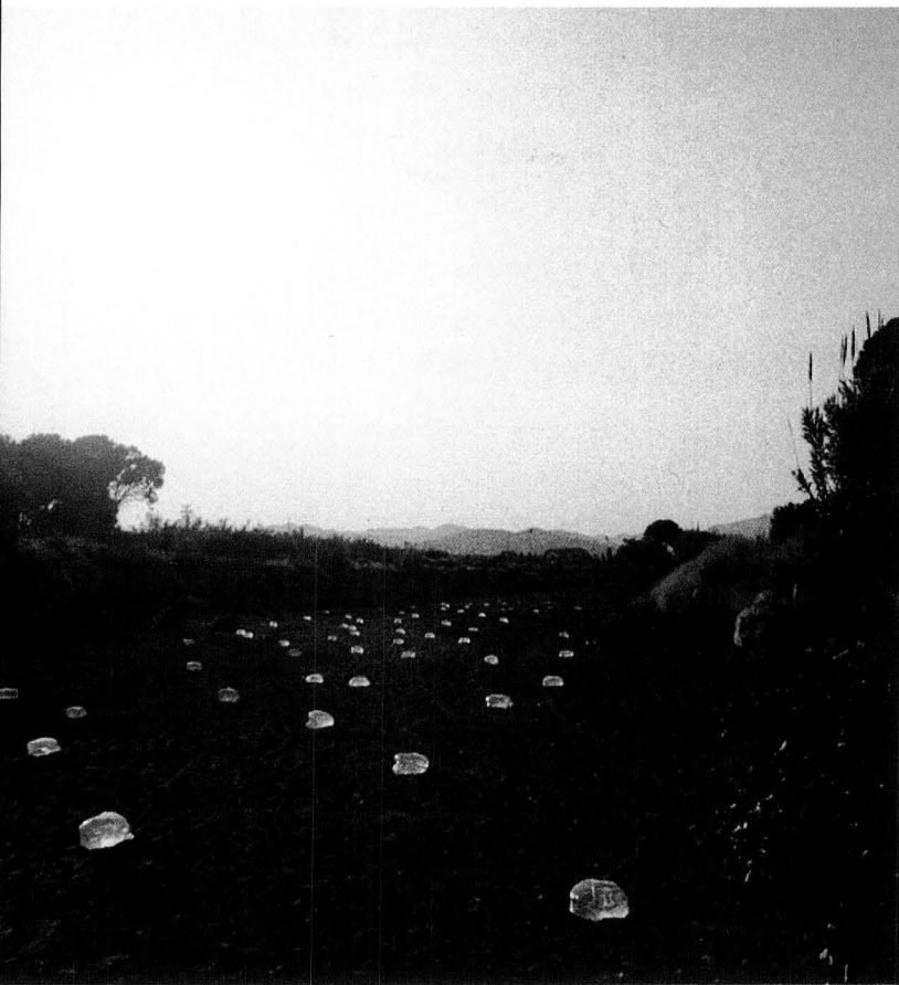
Letargia: instal·lació de bosses de plàstic plenes d'aigua a la llera de la riera de Maspujols, de Roger Caparó Ferrant.

elements naturals i locals a culturals i universals.