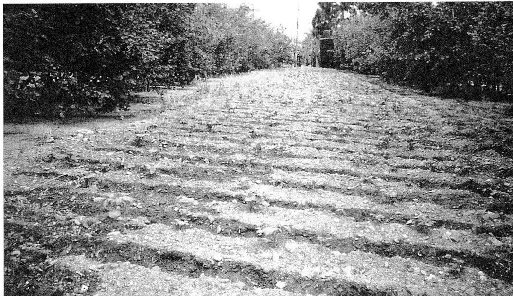
Bancal de patates cultivades en crestalls i regades amb aixada, entre tires d'avellaners.

VIOLANT I SIMORRA, Ramon: Etnografia de Reus i la seva comarca. El Camp, La Conca de Barberà, El Priorat . Barcelona: Alta Fulla, 1990.