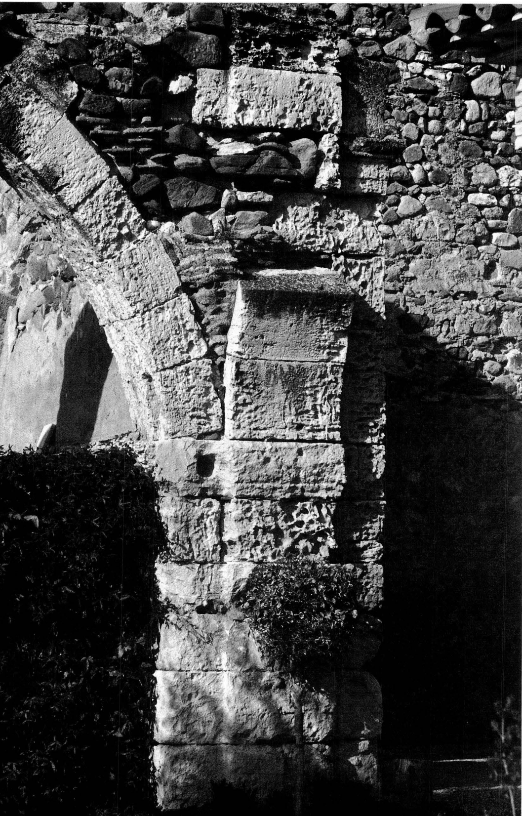
Interior del convent de Sant Francesc.