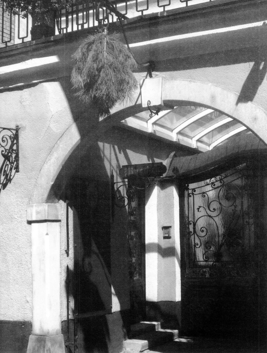
Taverna anunciada amb un brot de pi, a Viena, Àustria, com es feia a Riudoms en l'època de la Guerra del Francès.

amb un excedent resultant de 23.340 arroves. El vi produït es valora de baixa qualitat. També es parla de la producció de garrofes i d'hortalisses. Tota aquesta producció agrícola estava vigilada i controlada pel batlle, el rector i quatre prohoms més de la vila per tal de conèixer la producció real i evitar l'evasió d'impostos i el frau a la hisenda pública.