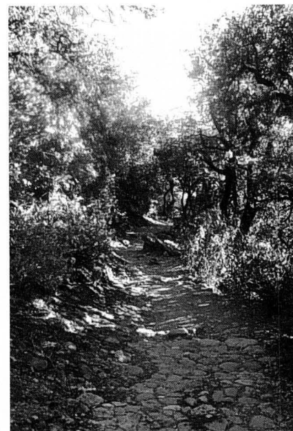
Cami dels Monjos.