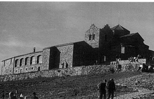
Monestir de Sant Llorenç del Munt, a la Mola.

monestir i seguirem cap al Montcau, l'altre cim important de la serralada. Al cap d'uns vint minuts ja serem a la Cova del Drac, que en realitat no és cap cova, sinó un penyal foradat que ha inspirat la llegenda del Drac de Sant Llorenç i de la qual hi ha diferents versions.