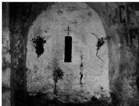
Interior de l'ermita de Santa Agnès.

"..Fra Bonaventura s'acomia- dà de l'erm de Sant Llorenç del Munt i de la joliva ermita de Santa Agnès, per tal de posar a la pràctica aquella idea santa que dins el recés de l'ermi-