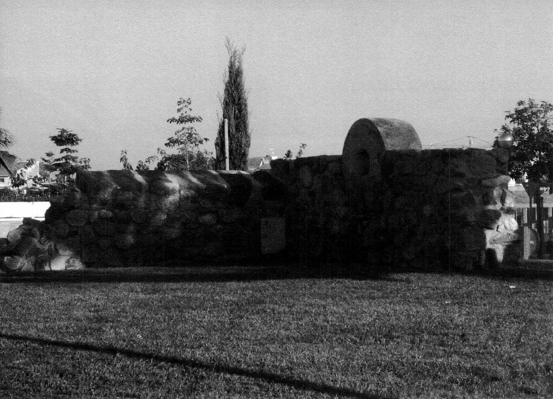
Restes dels antics rentadors de la Font Nova, de Riudoms, avui en una rotonda.

o de ferro, per facilitar l'estesa ordenada de la roba al sol i l'aire.