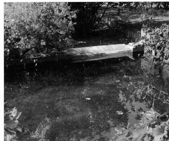
Bassa amb batedora a la partida del Mas de n'Albi.

“Els rentadors públics més antics que es coneixen a Riudoms són els de la Font Nova, documentats almenys des de 1613, alimentats amb l'aigua de la mina del Freixe, a la partida homònima”