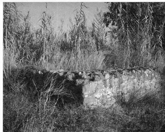
Restes dels rentadors vells de Riudoms, al carrer de Salvador Espriu.

Fil d'estendre. Corda o filament, d'espart