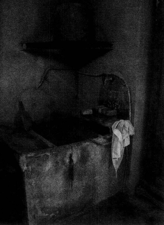
Safareig darrere la porta d'una casa.

XX, l'establiment de provisió de la sosa química per part dels riudomencs era cal Coder, a la plaça del Mercadal de Reus.