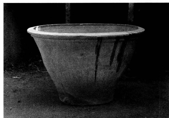
Cossi de test amb broc de sortida d'aigua per a fer bugada.

Segons fos la qualitat de la morca, a la pasta s'hi afegien solucions d'herbes o plantes destil·lades –romaní, llorer, llimones, etc. Avui a Riudoms no es té record de l'herba sabonera ( Saponaria officinalis ), succedània del sabó, però antigament havia estat utilitzada, collida a les platges de Vilafortuny i de Salou. Almenys durant la segona meitat del segle