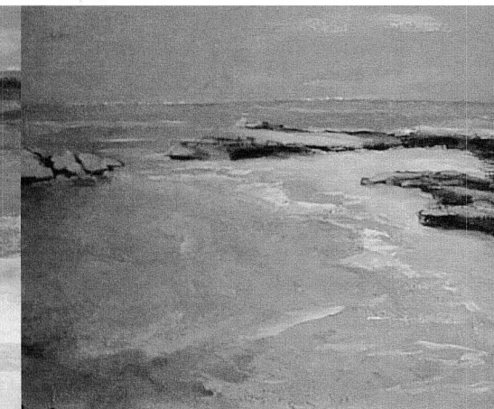
"Paisatge 2", tècnica acrílic sobre fusta, mida original 1000x800 mm.