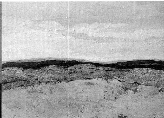
"Paisatge 4", tècnica acrílic sobre fusta, mida original 550x400 mm.