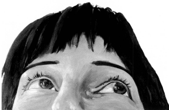
"Marta", obra inclosa a l'exposició de David Gázquez Sugranyes, realitzada en oli sobre tela. Foto: Jordi Ferré Piñol

El 2007 n'arriba aquesta 17a edició amb una dotació de 2790€ en premis, que inclou les modalitats d'investigació —dotada amb