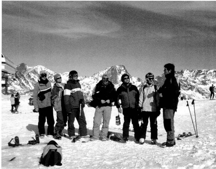
Esperant que arribi la resta del personal del telecadira per a tornar a esquiar, durant la "Sortida d'Esquí a Andorra - Vall Nord"

La Colla de Diables de Riudoms i la Secció de Muntanya cooperaren el passat mes de gener en una nova activitat: la "Sortida d'Esquí a Andorra - Vall Nord". Un total de 20 riudomencs participaren d'aquesta sortida els dies 26, 27 i 28 de gener amb un cost de 148€ pels socis i 155€ pels no socis, que incloïa l'allotjament a mitja pensió, transport i forfait amb assegurança completa. La manca d'una climatologia favorable jugà un paper negatiu en les previsions inicials, per la qual cosa s'hagué de substituir el transport amb bus pel lloguer de vehicles monovolums. Una vegada carregats tots els estris al Pavelló Municipal d'Esports, el grup sortia cap a Andorra amb l'objectiu de passar un bon cap de setmana entre amics i gaudir de les prime-