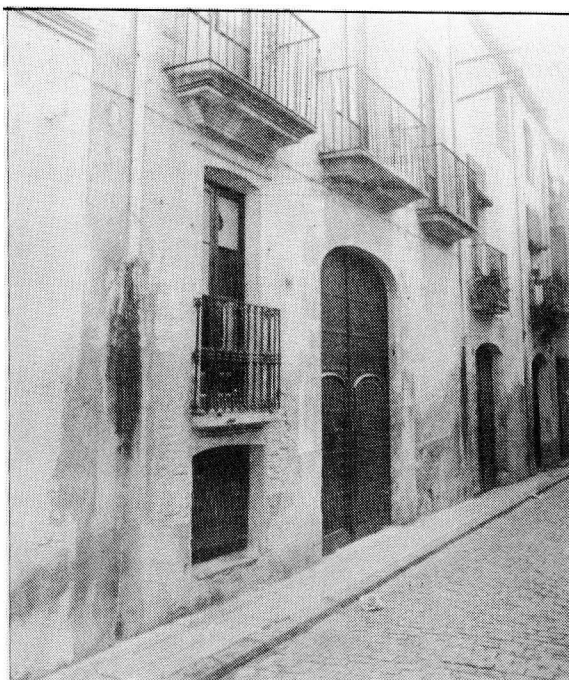
Les construccions o remodelacions arquitectòniques de la vila augmentaren considerablement en nombre durant el segle XVIII. A la fotografia, portalada de cal Marc Massó (s. XVIII), abans de ser rehabilitada com a Casa de Cultura.

Les olles d'aiguardent foren, llavors, freqüents en els pobles del Camp i el producte obtingut mitjançant recules de mules, arribarà a les platges tarragonines, sobretot al port de Salou. La característica barca catalana i vaixells de major calat transportaven els productes