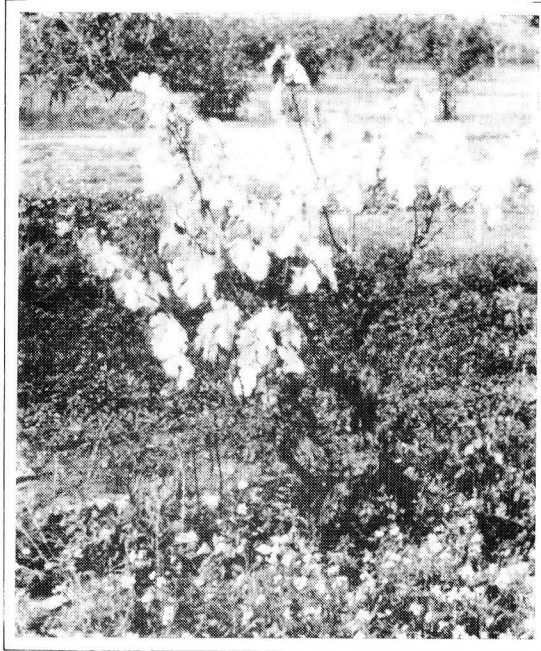
El pa, el vi i l'oli —cereals, viticultura i oliveres— formen la trilogia de productes alimentaris clàssics de la mediterrànea.

Ja des de finals del segle XVIII, Catalunya inicià una transformació