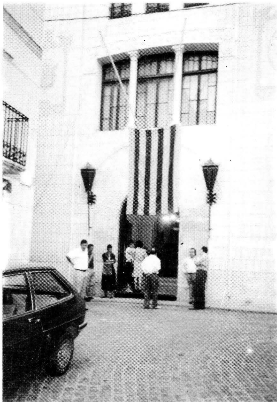
L'Ajuntament celebrà l'11 de Setembre amb un acte institucional a la Casa de la Vila.

Aquelles primeres edicions de l'11 de Setembre, amb un marcat caire reivindicatiu, ja són història. La Diada Nacional de Catalunya, com s'ha posat de manifest en els darrers anys, ha esdevingut, arreu i també a casa nostra, una festa rutinària més, un dia de lleure propici per escurar les darreres possibilitats de prendre el sol o banyar-se a les nostres platges. O per plegar avellanes, com és el cas de molts riudomencs, ja que, en aquesta època de l'any, s'escau la recol·lecció d'aquesta maltractada fruita seca. El fet que, a les balconades de les cases, es vegessin (per altra banda, com cada any), poquíssimes banderes catalanes i la poca assistència de públic als pocs actes programats, potser són els signes d'una normalitat nacional que molts ja donen per feta.