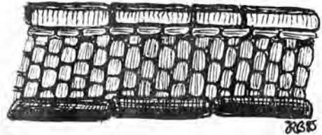
Dibuix de Joan R. Corts.

fent-ho no ho embelleïrem més. Em dóna la sensació que posarem un pedaç nou a una cosa que és vella i això sempre resulta malament. No els manca raó als que volen que es conservi una cosa que és patrimoni natural de Riudoms i no sols a Riudoms. Conec una mica qui fa la conservació a Reus: són dos o tres homes a punt de jubilar-se que quan faltin dubto que en trobin d'altres per seguir fent aquesta tasca».