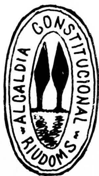
6. Any 1899 (f. núm. 833)