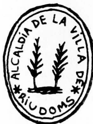
5. Any 1883 (f. núm. 525)