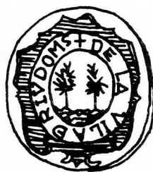
1. Any 1824 (fitxa núm. 546)

Sobre escuts i segells referents a Riudoms vegeu “Lo Floc” n.º 4, pàg. 6; 37, pàgs. 10-11; 38, pàgs. 18-19; 39, pàgs. 20-22.