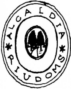
13. Any 1953 (f. núm. 445)