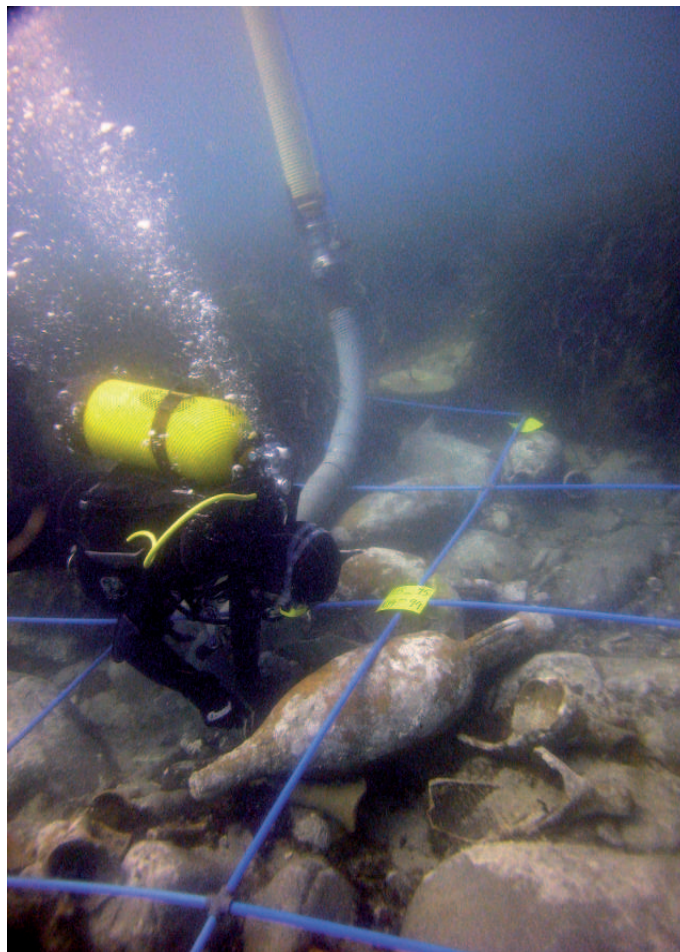
Arqueòleg realitzant treball d'excavació.

Per últim hi trobem el grup més nombrós dins les aigües de la cala Aiguablava, les àmfores. La seva funció era la d'emmagatzematge de productes per a ser transportats com el vi, l'oli o els salaons, convertint-se així en un dels objectes més importants dins la vida quotidiana i també per l'estudi del comerç i la història econòmica d'Època Antiga. Hi trobem àmfores d'arreu