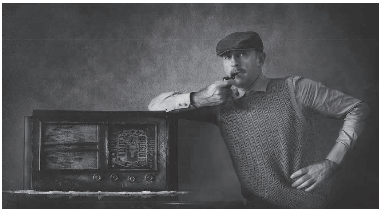
Concurs "Castell d'Or". Primer Premi Tema Lliure

Ensenyament (17-06-16): 200 alumnes de les escoles Vedruna i l'Era de Dalt reben consells per a una revetlla segura a través de l'obra de teatre Revetlles amb precaució (sala polivalent La Canal).