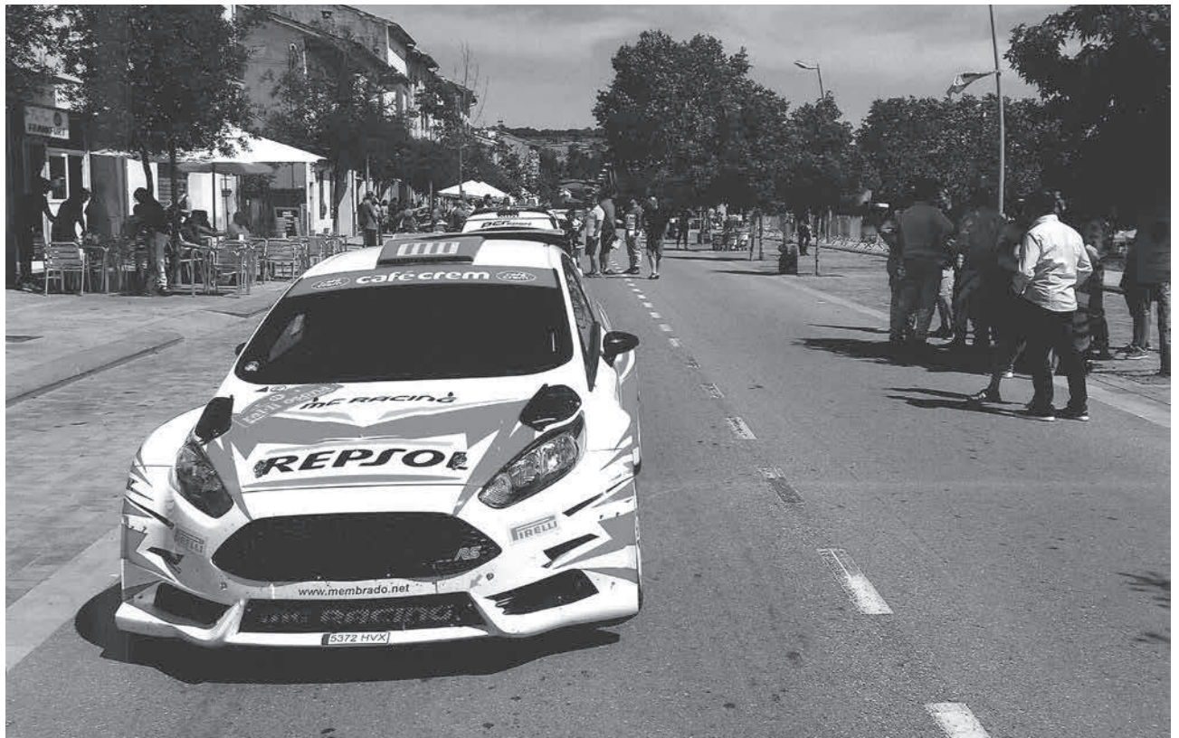
El carrer d'Antoni Figueras amb algun dels vehicles que van participar en el ral·li Osona 2016

Festes (24-07-16): Festival de la gent gran a càrrec del Grup d'Animació del Casal dels Avis.