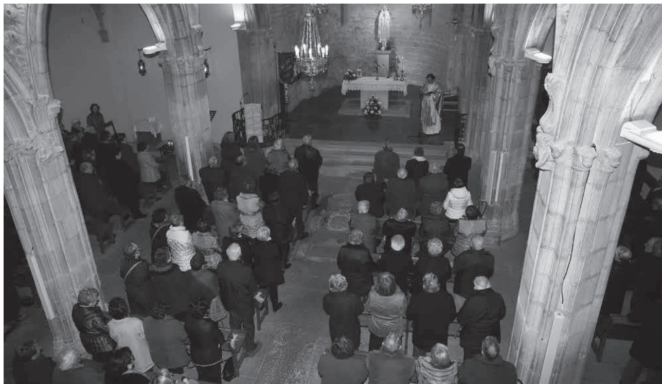
Festa patronal de l'Agrupació de Jubilats al santuari de Lurdes

Ensenyament (12-02-16): Taller formatiu: "Noves tecnologies aplicades a l'exploració, registre i anàlisi arqueològica" (Centre d'Interpretació del Camp de les Lloses).