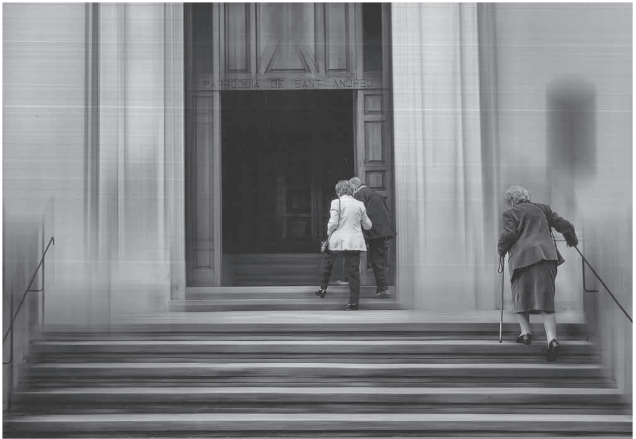
Concurs "Castell d'Or". Primer Premi Local

Serveis (12-01-16): Una delegació del Ministeri de Salut, Afers Socials i Ocupació del Comú