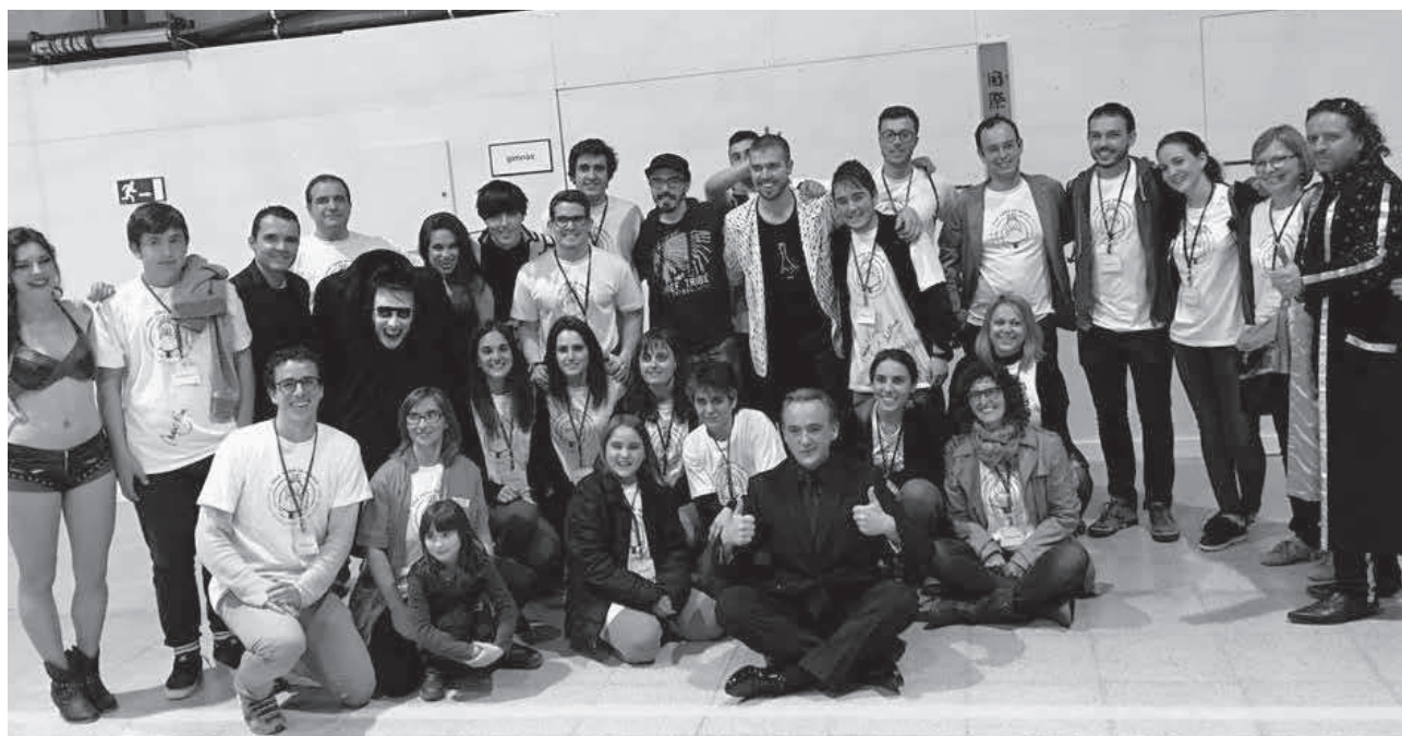
Els voluntaris del festival Una Tona de Màgia