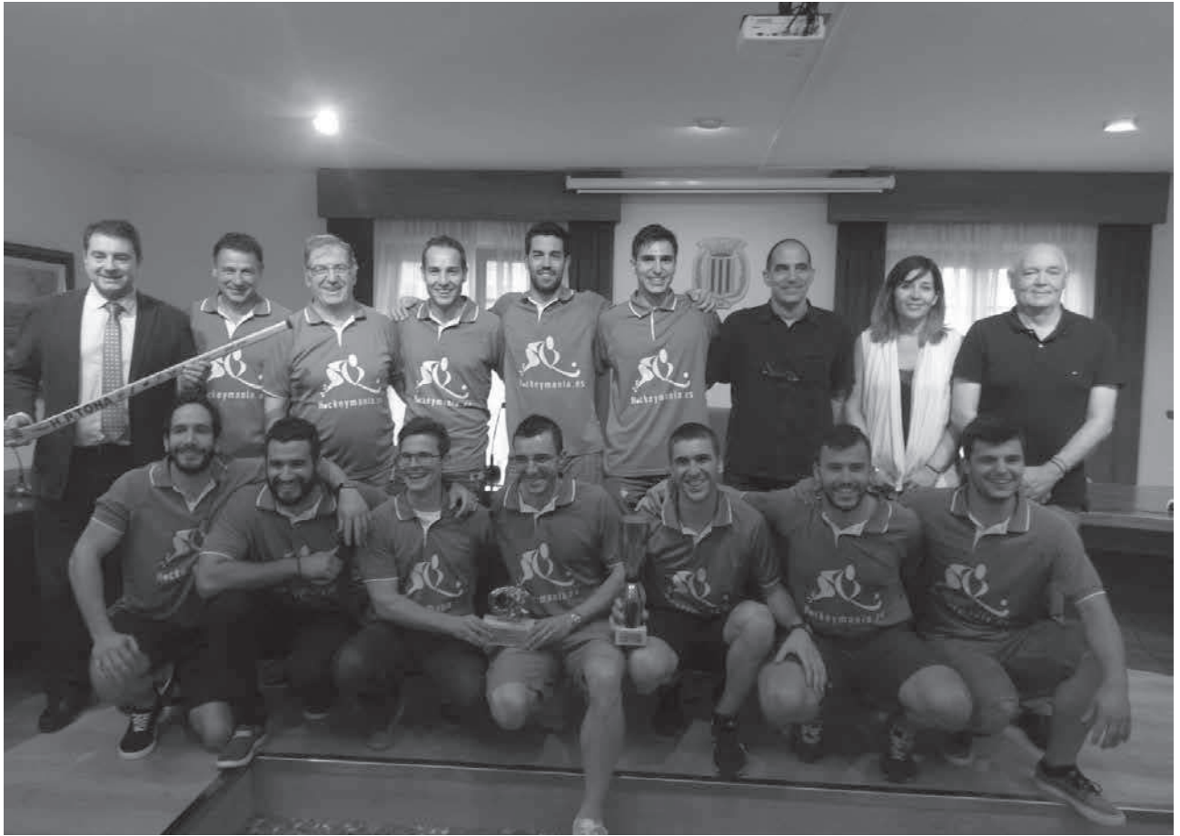
Recepció a l'ajuntament de l'equip sènior del CH Tona guanyador de la Supercopa Nacional Catalana

Cultura (27-09-16): La companyia Les Bianchis representa l'obra de teatre Les supertietes (sala polivalent La Canal).