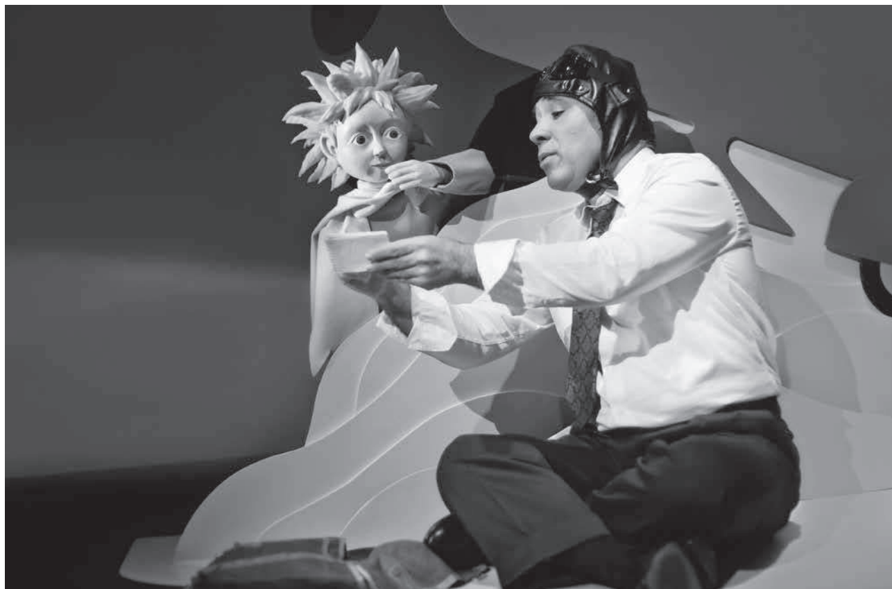
Representació de l'obra El petit príncep a la sala polivalent La Canal, un dels espectacles del projecte Teatrets d'Osona

Cultura (30-10-16): Representació del conte El petit príncep , a càrrec de la companyia de teatre Cia. N54 (sala polivalent La Canal).