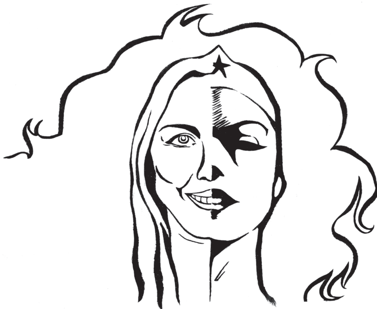
Il·lustració: Aleix Bascompte

Doblegant el paper va buscar al sobre alguna referència, és clar, hi havia el seu nom escrit però podia ser el de ... Va col·locar aquest full en un sobre nou i va escriure un nom, va desfer el camí de les escales i el va llençar en una altra bústia.