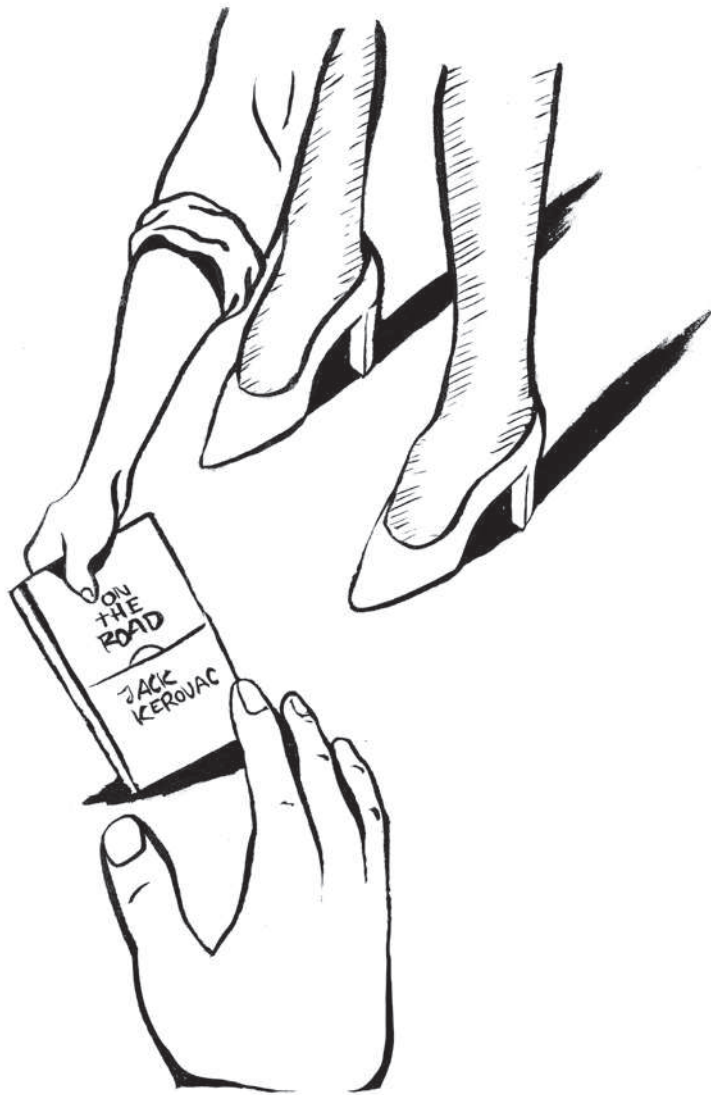
Il·lustració: Aleix Bascompte