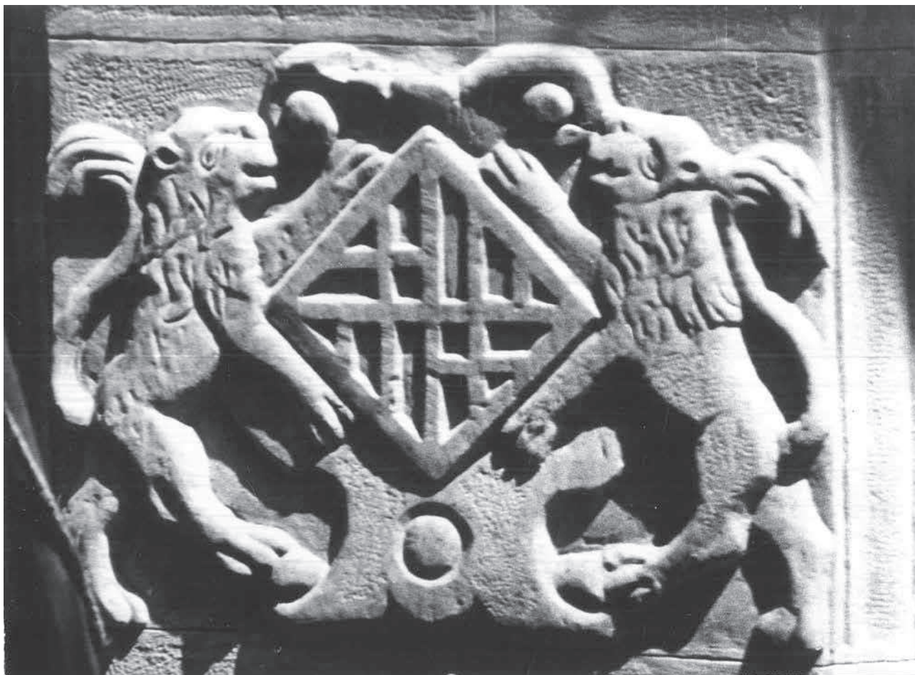
Escut caironat de l'antiga casa de la confraria de paraires i teixidors o de Sant Joan, al carrer de Barcelona, del 1646, amb un camper amb les armes de la ciutat de Barcelona. En aquesta casa s'hi celebraren també sessions del Consell municipal (el que ara en diríem l'Ajuntament)

Catalunya només un municipi té la corona de sobirania o reial: Barcelona, perquè havia estat la capital d'un estat sobirà. Evidentment, l'escut de Catalunya també hauria de portar la corona de sobirania, però malauradament, essent el país que té l'escut més antic d'Europa, també és l'únic país del món que no el té oficialitzat i en el disputen els aragonesos. Les entitats municipals descentralitzades es diferencien dels municipis perquè no porten corona.