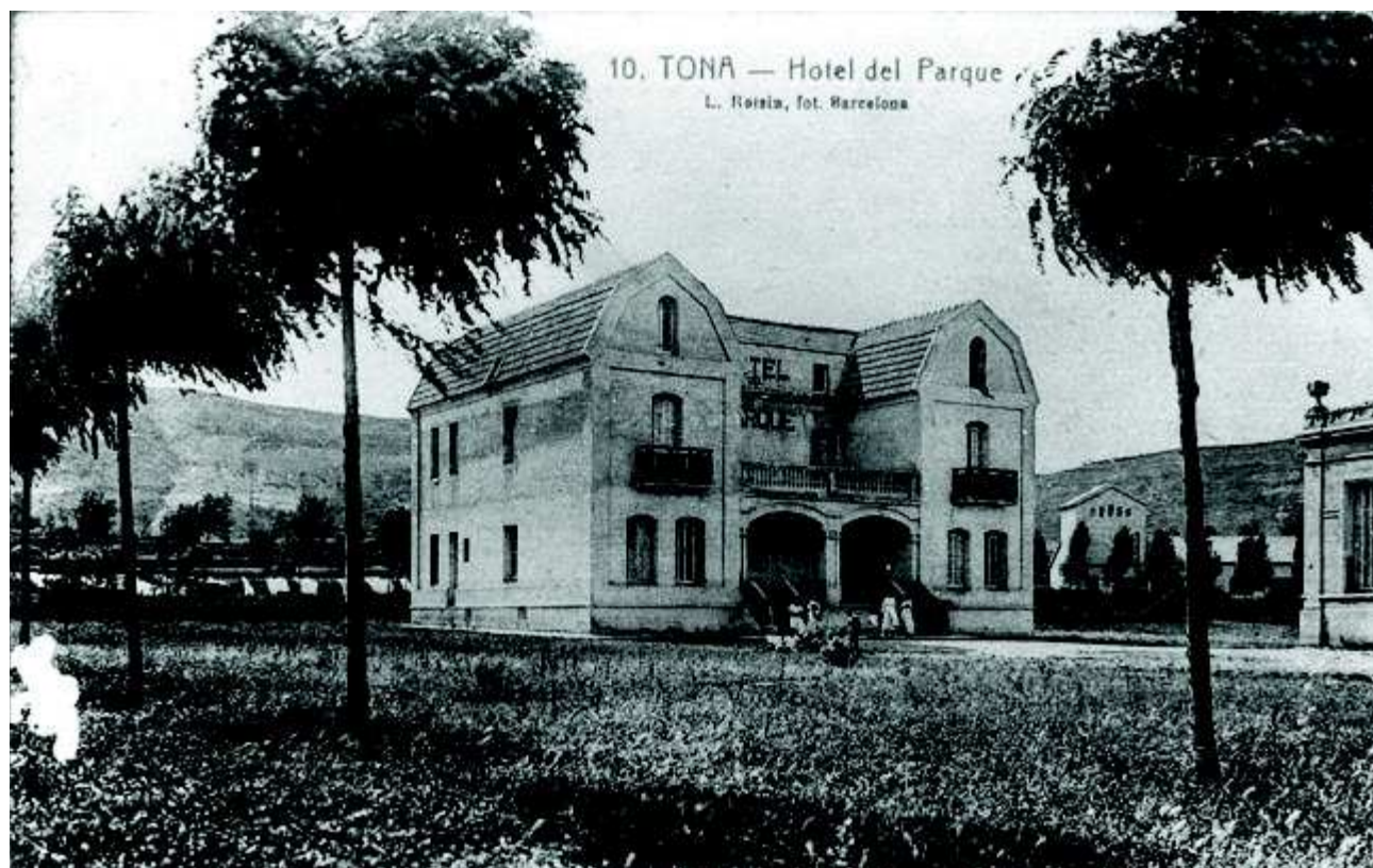
L'hotel del Parque, bastit el 1918. L'edifici és ara embegut entre les construccions del col·legi Pive

L'any 1947 vaig entrar d'aprenent a la fusteria d'en Lluís Bruch. Em faltaven encara més de quatre mesos per fer els 14 anys. Això sí, en ferlos ja em van assegurar. De primer vaig ser aprenent de fuster, però vaig acabar a l'envernissador per ajudar en Joan, conegut com el Francès . D'entrada vaig cobrar 25 pessetes a la setmana, 5 duros que en dèiem. Avui no arriben a 20 cèntims d'euro. Això sí, de mica en mica la cosa va anar millorant.