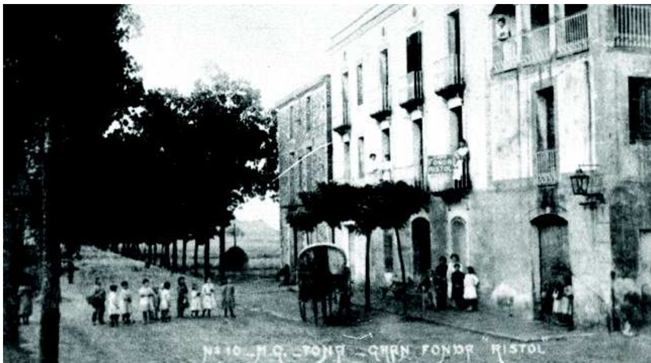
La fonda o hotel Ristol, a la carretera de Barcelona (1909)

Un altre cas eren els nois que es llogaven en botigues, principalment en pastisseries i en fruiteries. Tot això era a l'estiu. Molts estieujants