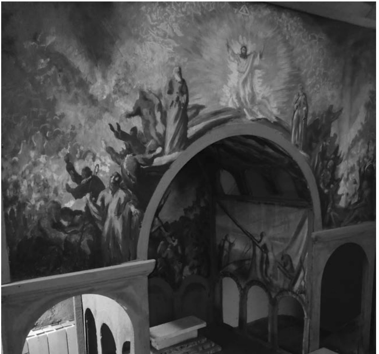
Maqueta del projecte de decoració mural de l'església parroquial de Sant Andreu de Tona