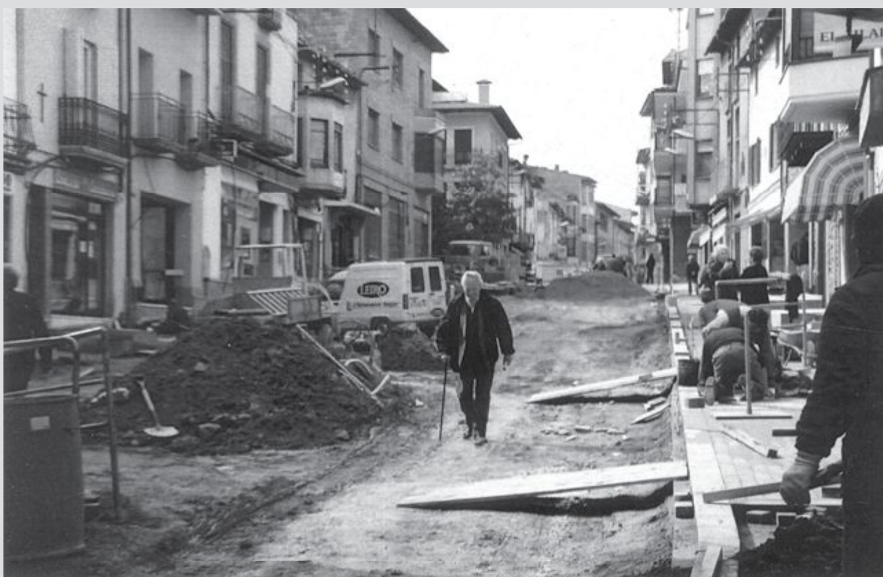
Felip Vall de camí cap al seu estudi, en plenes obres de remodelació del carrer Major (2002)