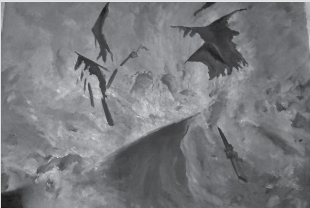
Quadre que il·lustra la introducció del poema L'Atlàntida, pintat als anys setanta

1954: Es presenta al concurs per pintar el Teatro Real de Madrid.