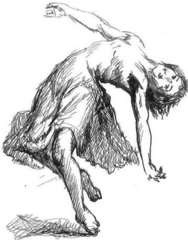
Dibuixos de ballarines del Ballet Nacional de Iugoslàvia (París, 1951)