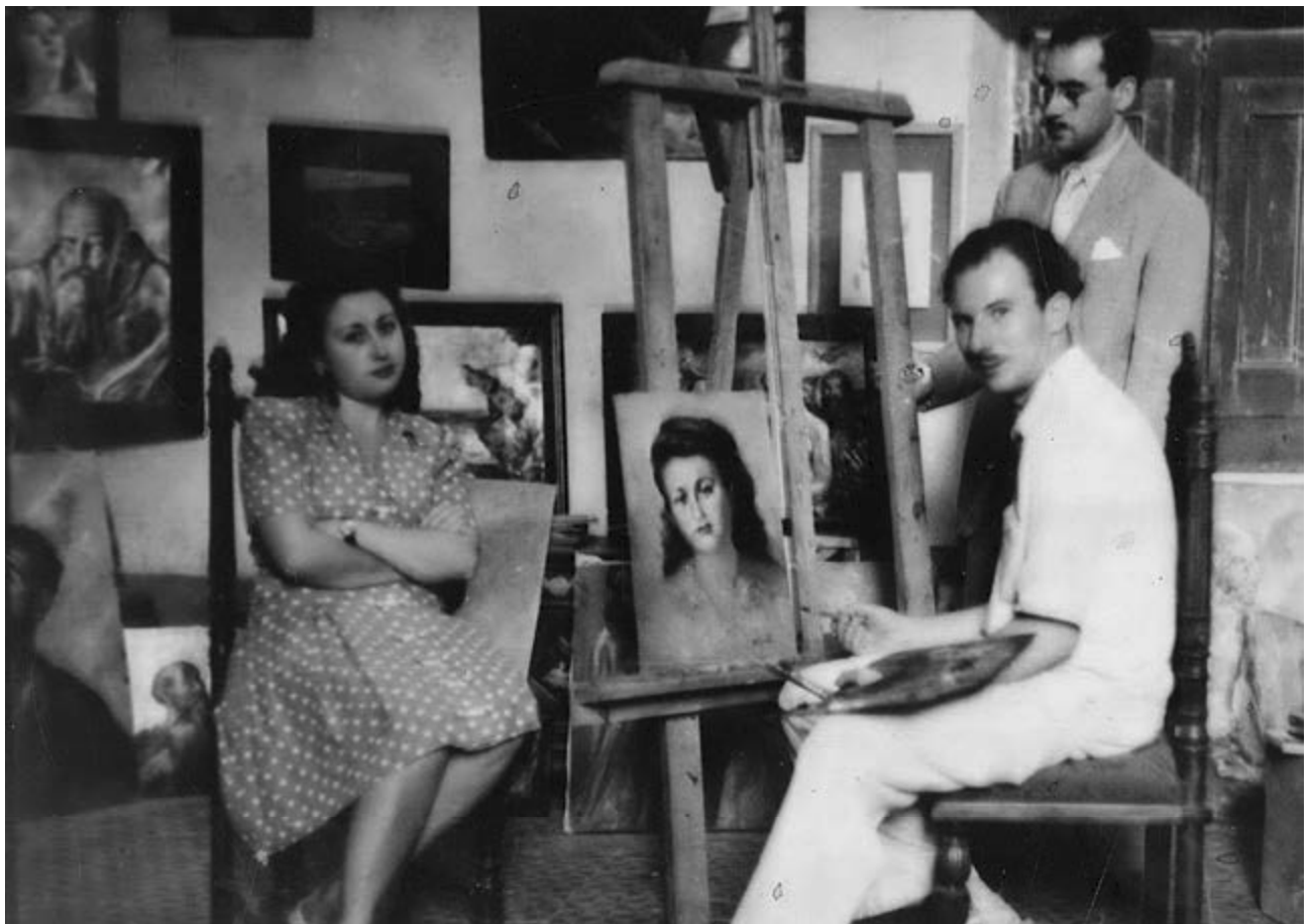
Al mateix estudi als anys quaranta fent un retrat a l'oli