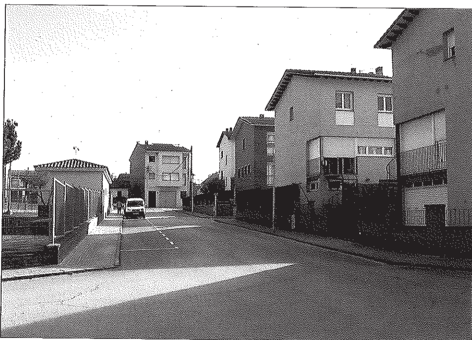
El carrer de Mossèn Joan Colom, prop de l'escola l'Era de Dalt. Cap casa té la seva façana principal encarada a aquest carrer

Molts noms de carrer no sabem com van néixer, però d'altres sí. Per exemple, el carrer Bonavista. Un dia en una visita d'obres, l'alcalde Sr. Baucells i un grup de persones es miraven el panorama que es veia des del Gelec i algú va dir: "Quina vista tan bona es veu des d'aquí!", i ja està, el nom va sortir rodó: ja tenim el carrer Bonavista, just al davant de la fàbrica Estabanell. Avui un dels carrers de la urbanització del Pla del Gelec continua portant aquest nom.