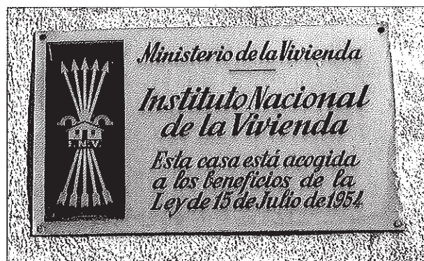
Placa de l'Instituto Nacional de la Vivienda, amb el jou i les fletxes falangistes, fixada a la façana d'una casa del carrer de Pompeu Fabra

Una darrera cosa sobre el carrer de Pompeu Fabra: malgrat el seu nom, és l'únic del poble on encara s'hi poden veure, a la façana d'algunes cases, plaques de l'Instituto Nacional de la Vivienda amb el jou i les fletxes!!.