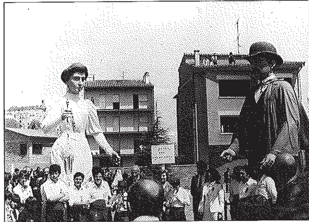
Un moment de la inauguració de la plaça del Noi de Tona, el 24 d'abril de 1983

Dels noms dels carrers, el més inversemblant de tots és el de Pompeu Fabra. Té una història llarga, estranya i poc creïble, però va anar així: l'any 1968 es va escaure el centenari del naixement del mestre de