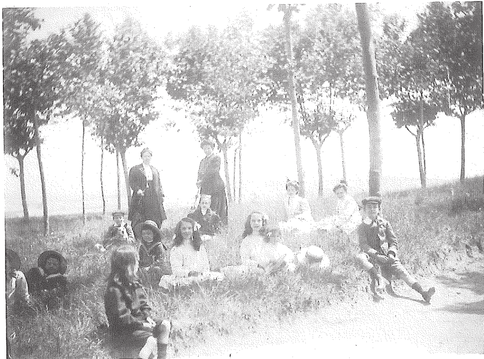
El mateix dia al parc d'entrada al balneari Ullastres (juny de 1909)