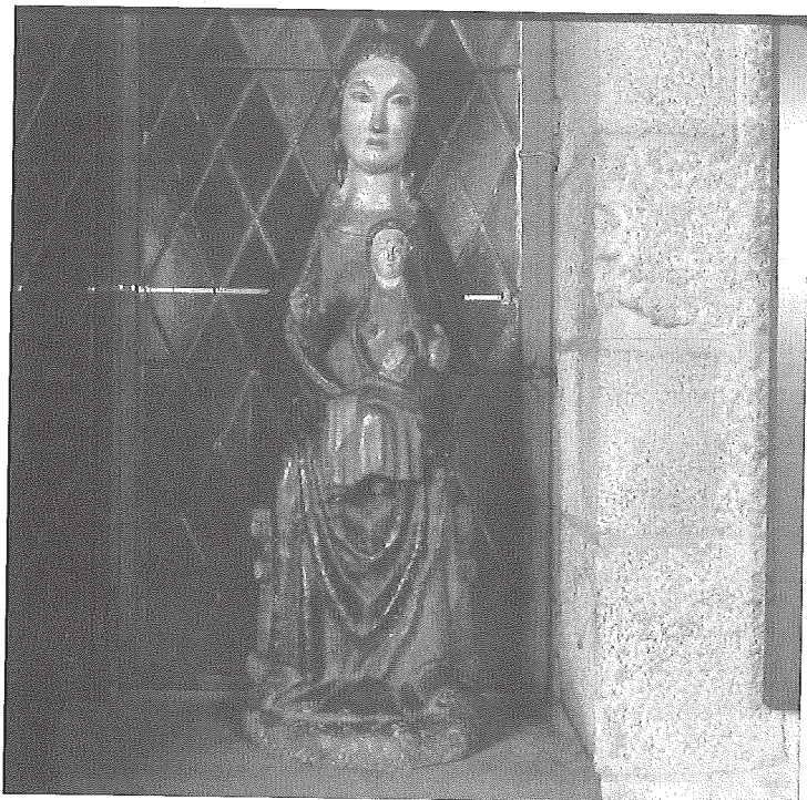
La talla de la Mare de Déu que procedeix de la col·lecció del mas Rimbau i que ara forma part del Museu Frederic Marès. Es data del segle XIV