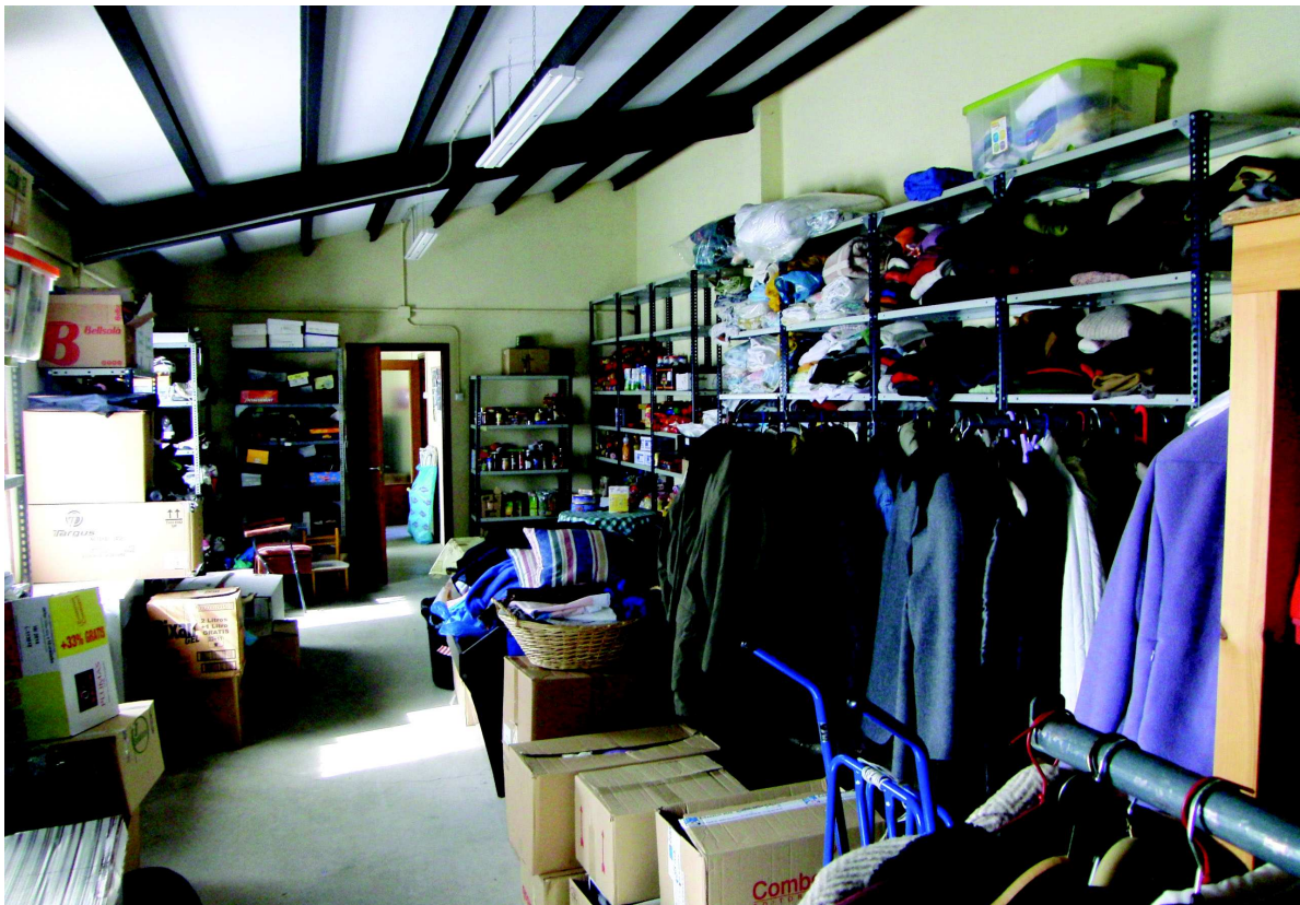
Interior del rober i banc d'aliments de Càritas Parroquial de Tona

L'any 1993 el municipi de Tona es va adherir a la Mancomunitat Intermunicipal voluntària La Plana. Un dels serveis que l'Ajuntament de Tona li va diferir, tot i que s'ofereix des de les instal·lacions municipals, és el de Serveis Socials i Ciutadania que inclou, entre d'altres, serveis socials bàsics, atenció a les dones, serveis d'acollida i immigració, atenció domiciliària i convivència. Pel que fa als serveis socials, i abans d'analitzar les característiques i situació actual de Tona, cal tenir en compte que el sistema de serveis socials ha viscut en la darrera dècada uns canvis molt importants. Per una banda els canvis demogràfics i socioeconòmics: la població de Catalunya ha sofert un envelliment progressiu durant els darrers anys, amb especial incidència en les persones majors de 84 anys.