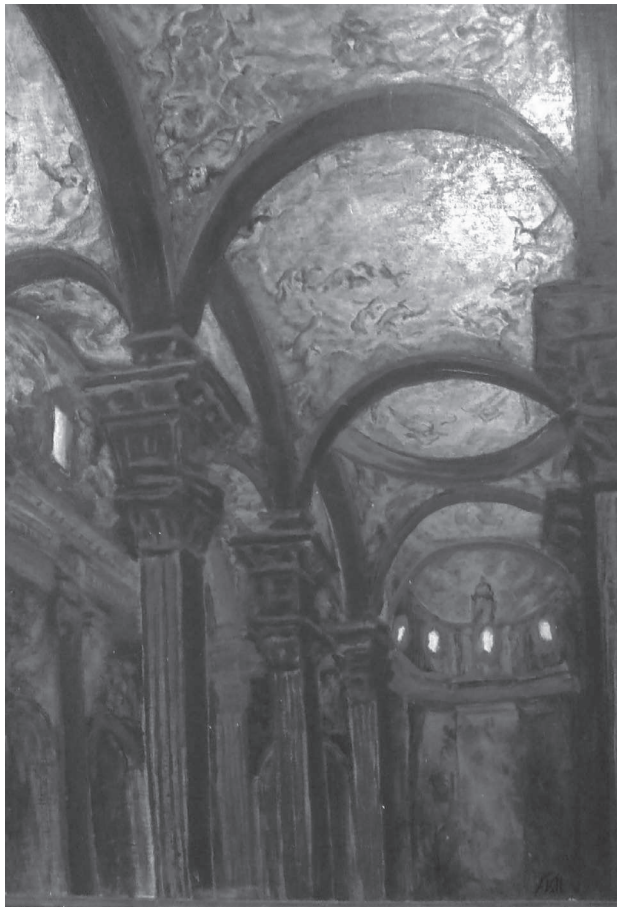
Pintura de Felip Vall del projecte de sostre de la catedral de Vic (1947). Base metàl·lica i pintura sobre fullola (Arxiu Felip Vall)

Després d'haver pintat força pintures murals, com ara la decoració de la capella del Santíssim