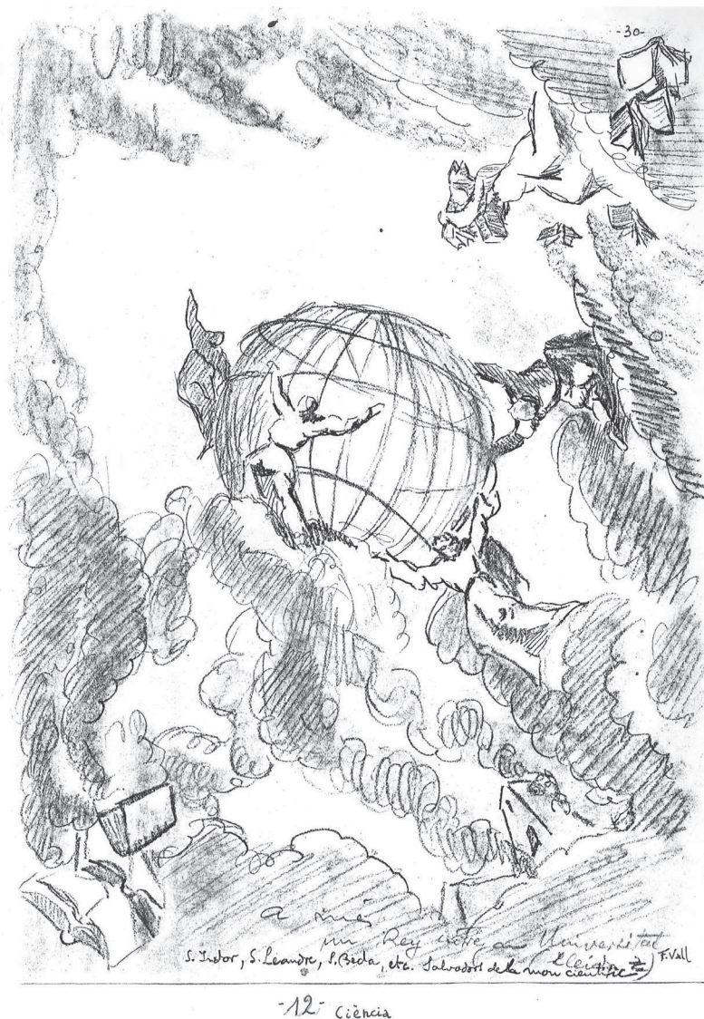
Esbós de Felip Vall per a la volta número 12 (Ciència) de la catedral

1. Es pot veure una entrada sobre el cine Diagonal al blog sobre Felip Vall: www.felipvall.blogspot.com.es