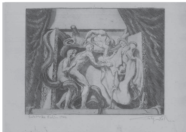
Aiguafort de Felip Vall (1946) sobre el tema "Desposorio del hombre con la muerte", de Josep Maria Sert

A la catedral de Vic l'idea era continuar els colors càlids de sota voltes, fins a fondre'ls en colors freds (blau-verds) cada vegada més pàl·lids fins el cim de les cúpules. Sembla donarien esveltesa a l'arquitectura interior: ara tan feixuga!. Efecte que clarament es dedueix de la foto corresponent al projecte.